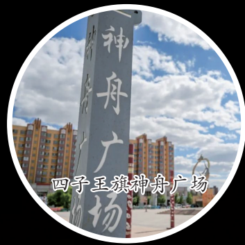
无人机拍摄的四子王旗照片