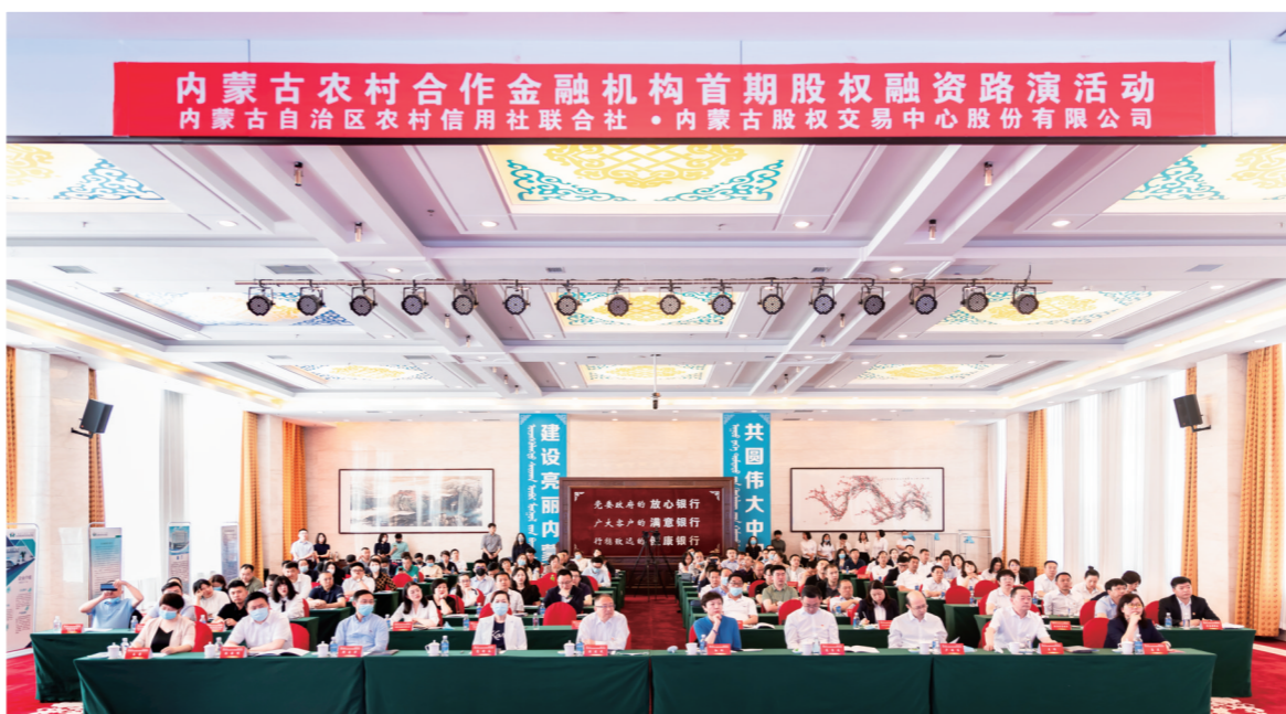
内蒙古农村合作金融机构举办首期股权融资路演活动。