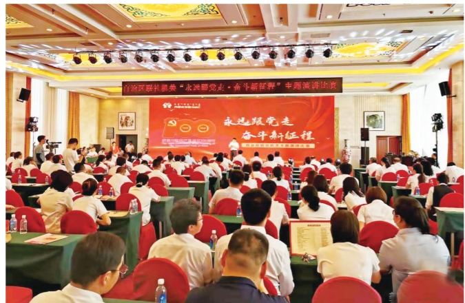
自治区联社机关举办“永远跟党走、奋斗新征程”主题演讲比赛。

用好红色资源,开展主题党日活动。充分利用红色资源,前往爱国主义教育基地,就近就便开展主题党日活动,通过实地参观、聆听讲解、现场学习等方式,重温党的光辉历程,缅怀革命先烈,增强党史学习教育的实效性和感染力。自治区联社机关组织退休老干部老同志到红色教育基地参观学习,召开“我看建党百年新成就”专题座谈会,和林县联社等法人机构组织党员干部到红色教育基地开展庆祝建党100周年主题党日活动;临时党支部组织党员开展党史学习教育不“临时”。在包钢,切身感受全国人民齐心协力建包钢的恢弘历史场景,在烈士陵园,追忆革命艰苦历程,缅怀烈士的丰功伟绩,进一步坚定理想信念,激发前行动力。