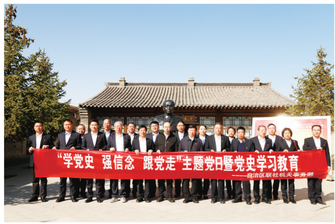
自治区联社机关组织退休老干部老同志开展主题党日活动。

党史如明灯,照亮前行之路,党史如清泉,洗涤心灵之尘,党史如号角,激发奋进之力。作为全区资产规模最大、从业人员网点最多、服务范围最广的地方性金融机构,内蒙古农村信用社各级党组织引导全体党员自觉做到学史明理、学史增信、学史崇德、学史力行,把学习成果转化为工作动力,不断创新金融服务方式,提升金融服务质效,建设党委政府的放心银行、广大客户的满意银行、行稳致远的健康银行。(祁国栋 朱鑫旺)