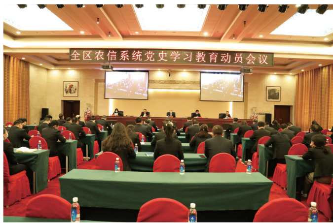
自治区联社党委召开全区农信系统党史学习教育动员会议。

百年征程波澜壮阔,百年初心历久弥坚。按照中央和自治区党委部署,全区农信系统各级党组织立足实际,统筹抓好党史学习教育、四史宣传教育和金融服务各项工作,立足群众需求,排忧解难,推动党史学习教育高标准高质量开展。