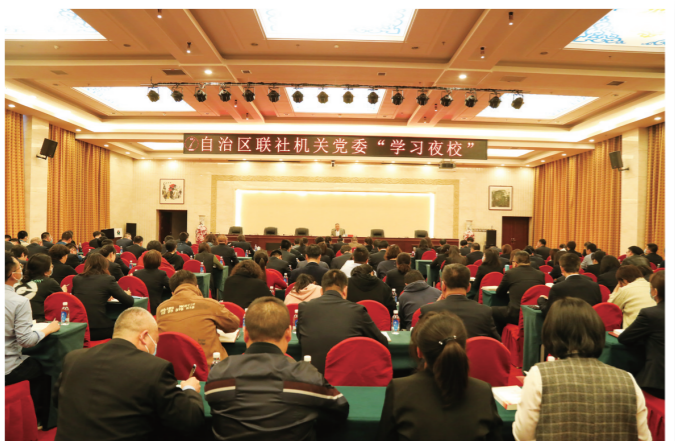
讲述党史故事,追寻红色记忆,自治区联社党委开办“学习夜校”。