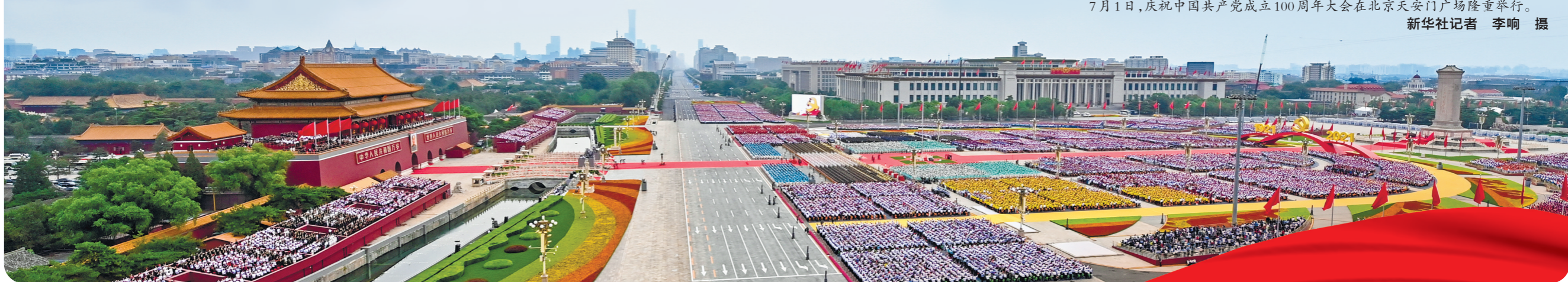
7月1日,庆祝中国共产党成立100周年大会在北京天安门广场隆重举行。