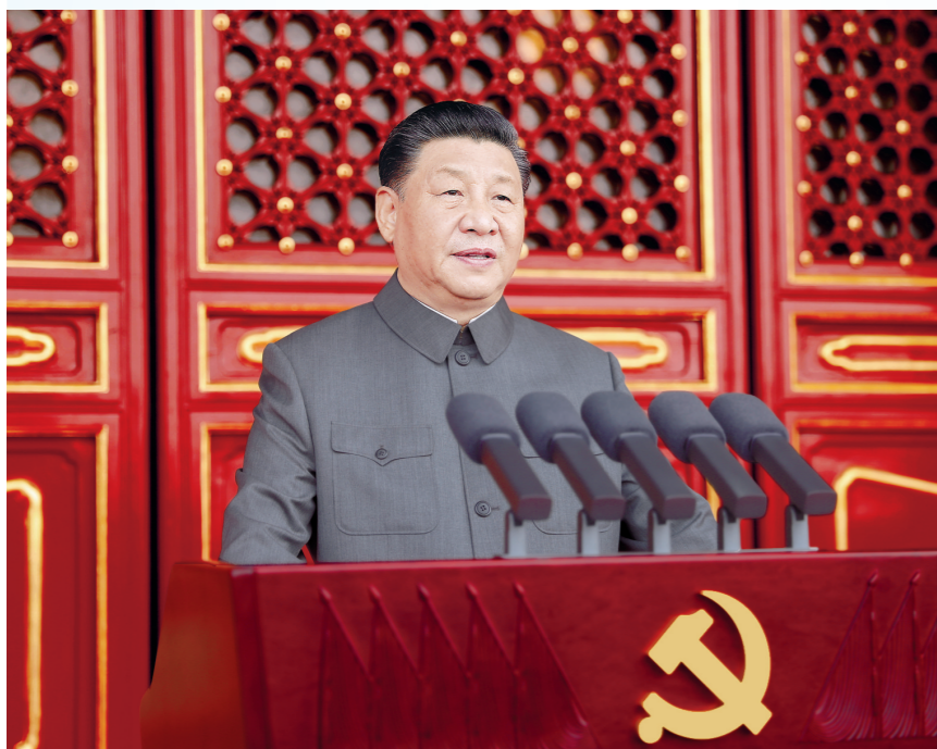
7月1日,庆祝中国共产党成立100周年大会在北京天安门广场隆重举行。中共中央总书记、国家主席、中央军委主席习近平发表重要讲话。