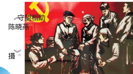
守望相助