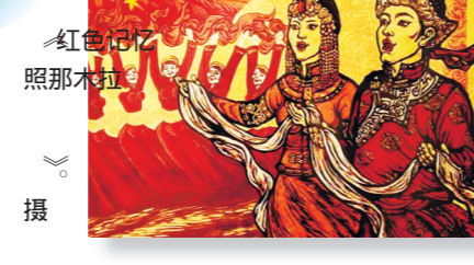
红色记忆