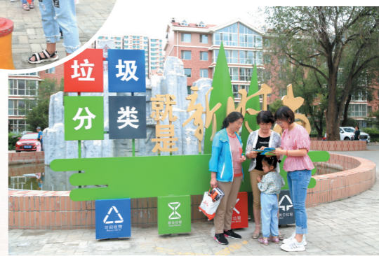
介绍垃圾分类方法,党支部服务队