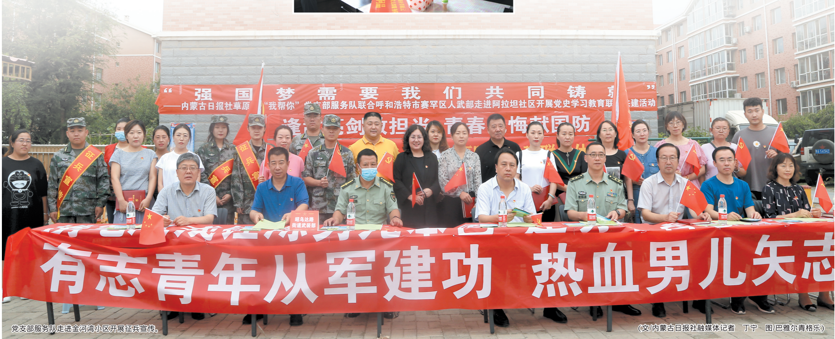
党支部服务队走进金河湾小区开展征兵宣传。