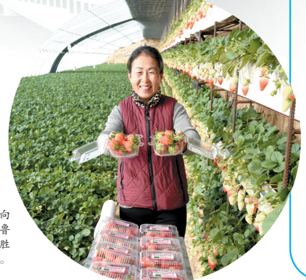
种植户向大家推荐阿鲁科尔沁旗双胜镇北山村草莓。