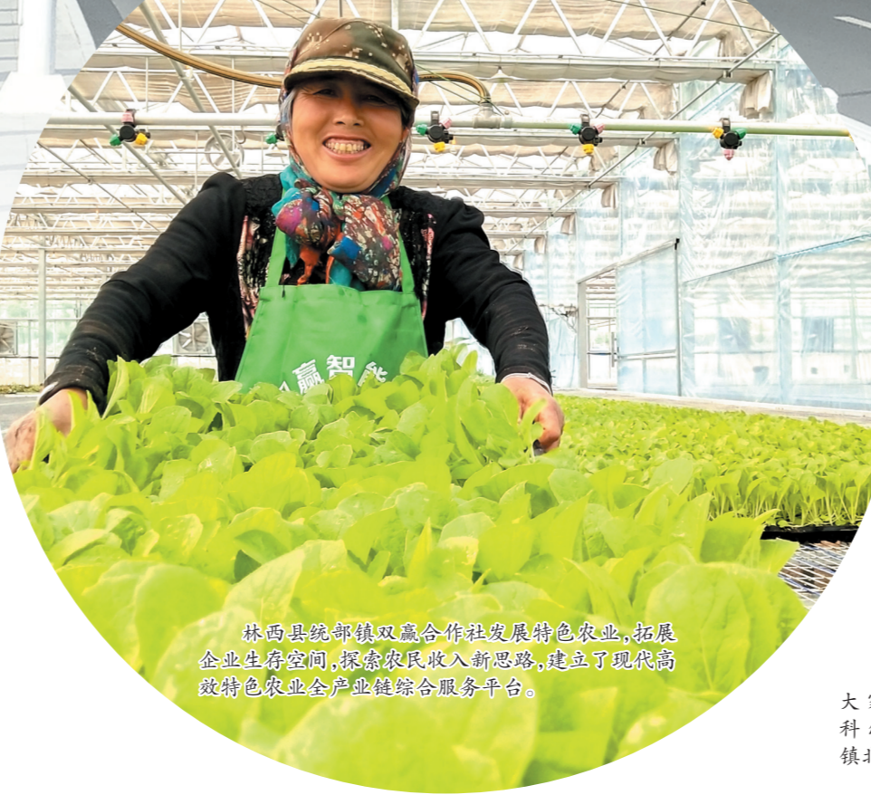
林西县都镇伟镇双联合作社发展特色农业,拓展企业生存空间,探索农民收入新思路,建立了现代农牧业特色农业产业综合服务平台。

败高压态势,严惩基层“微腐败”,毫不放松纠治“四风”,深入开展煤炭、林草、人防等领域违法违纪问题专项整治,严肃查处一批违纪违法干部,政治生态实现好转。 征途漫漫,惟有奋斗。