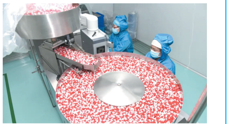
天奇制药生产一线。