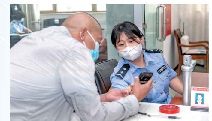
赤峰市政务服务中心窗口工作人员耐心地教办理人使用“蒙速办”APP。