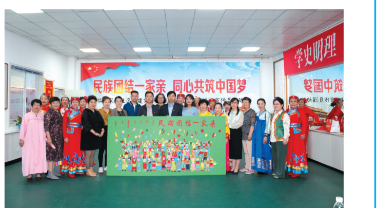
临潢家园社区居民制作的毡绣作品《民族团结一家亲》。