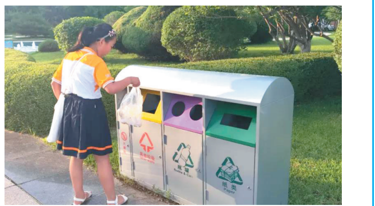
喀喇沁旗小学生自觉进行垃圾分类。