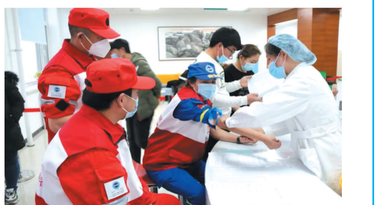
克什克腾旗血库告急,蓝天救援雪中送炭。