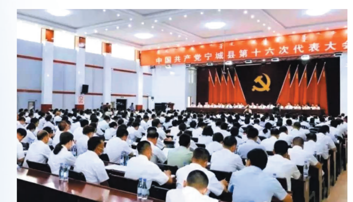
赤峰市12个旗县区全部圆满完成党委换届。

着力优生态、抓发展、强基础、惠民生、增活力、保稳定,不断加强和改进民族工作,走好以生态优先、绿色发展为导向的高质量发展新路子,为实现“十四五”规划目标、创造赤峰人民更加美好生活不懈奋斗。