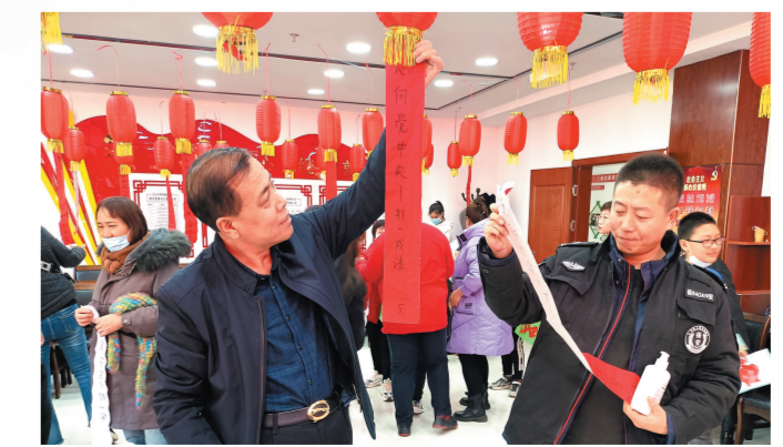
红山区铁南社区组织辖区党员和居民开展“巧手剪庆元宵”暨党群群灯灯谜主题活动。