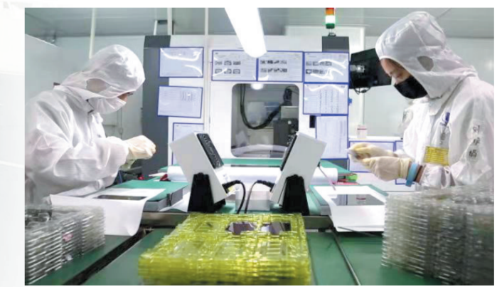
赤峰托佳电子公司作为国家高新技术企业,年实现工业产值近7亿元,与京东方、华为、小米等行业领军企业形成长期稳定的战略合作关系。

征途漫漫,惟有奋斗。在赤峰市第八次党代会开幕式上,赤峰市委书记万超峰满怀信心地说,在新一代赤峰人的努力下,古老的赤峰正展现新的魅力。今天,建设赤峰,发展赤峰的接力棒交到了我们手中,愿好这一棒,我们责无旁贷,义不容辞。我们要更加紧密地团结在以习近平同志为核心的党中央周围,在自治区党委的坚强领导下,凝心聚力、开拓进取,以更加饱满的热情、更加昂扬的斗志、更加务实的作风,投身到推动赤峰高质量发展的具体实践中,为实现“十四五”规划目标、创造赤峰人民更加美好生活不懈奋斗!