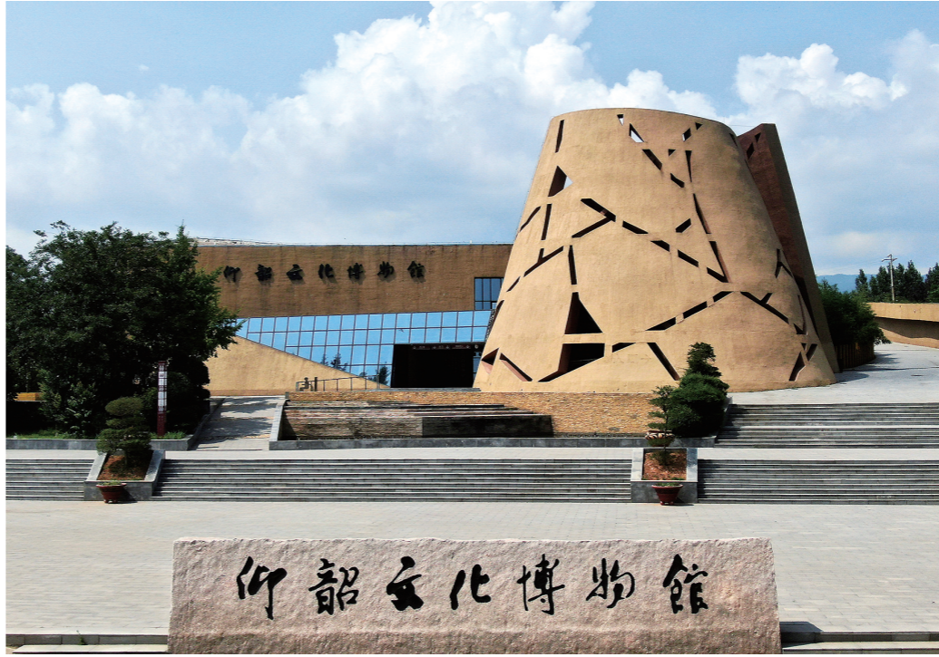
位于河南省三门峡市渑池县的仰韶文化博物馆(2020年7月15日摄,无人机照片)。

修国史、写续篇,从李济、梁思永到夏鼐、苏秉琦,几代考古人秉承初心、筚路蓝缕,通过对一个个重大文化遗存的发现和发掘,中华文明的历史轴线不断延伸。