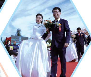
百对佳偶走红毯。陈玲 摄