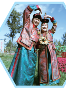
新婚夫妻比心合影。