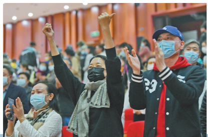
央视《大幕开启》节目讲述舞剧《骑兵》幕后故事。