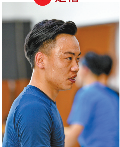
每次训练完巴音达来都满头大汗。