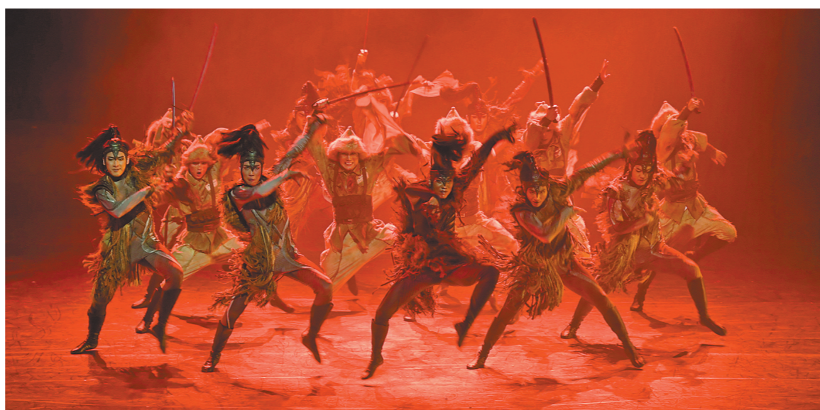
2020年9月,从全国29部作品中脱颖而出的8部作品角逐第十二届中国舞蹈“荷花奖”舞剧奖,《骑兵》作为内蒙古唯一一部入选评奖的作品,荣登榜首,喜摘“荷花”。