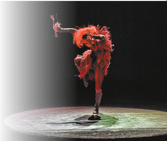
一上舞台,我就是“尕腊”。