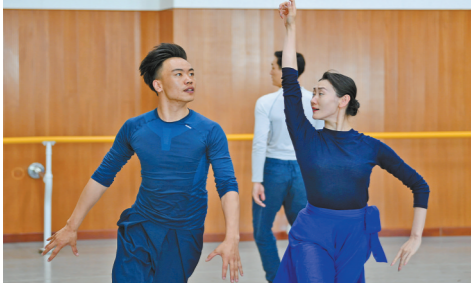
巴音达来和《骑兵》另外两名主演一同训练。