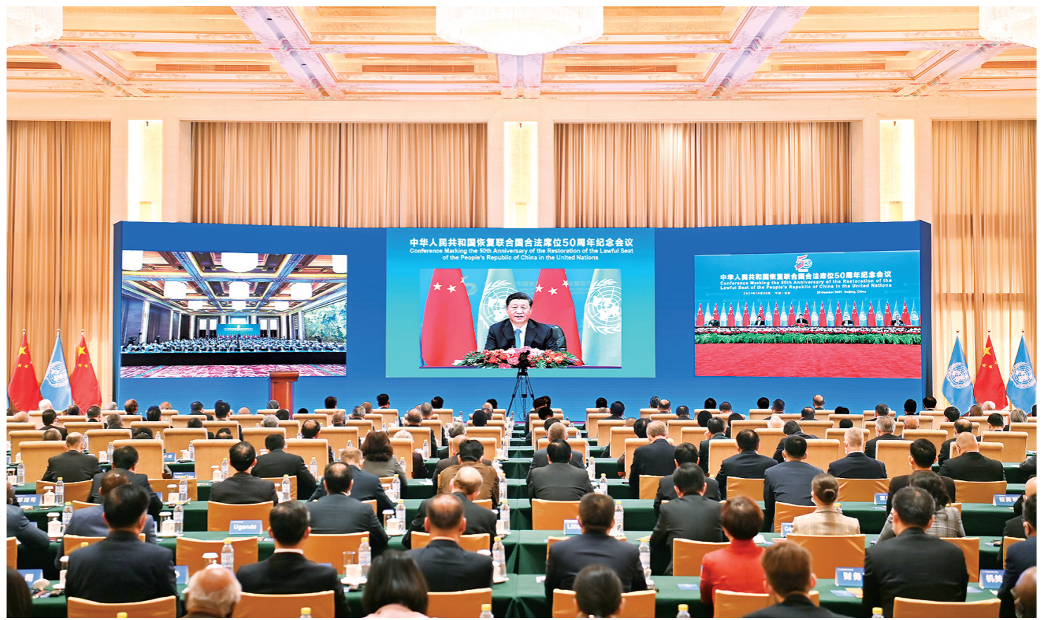
10月25日,国家主席习近平在北京出席中华人民共和国恢复联合国合法席位50周年纪念会议并发表重要讲话。