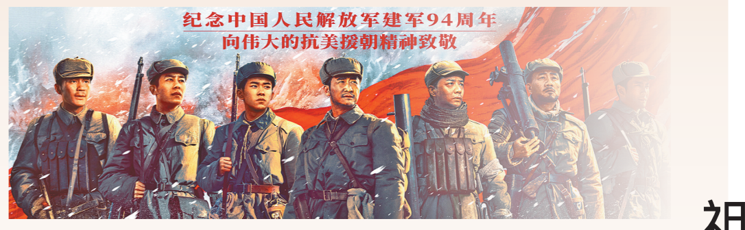
纪念中国人民解放军建军94周年 向伟大的抗美援朝精神致敬

一个懵懂无知的乡下少年，从南国家乡的湖边恣意嬉闹奔跑，到异国他乡的湖边冒着敌人的炮火猛打猛冲。一个组中有烟的中年汉子，闯过无数次鲜血与炮火的生死关口，精准地将一发又一发炮弹送到敌人头顶，给凶残的敌人以雷霆暴击，在沂蒙山的歌剧中壮烈牺牲。一个把思念深藏心底的父亲，在严酷的战场环境下，贴身衣兜里总是装着女儿的照片，内心对亲人有多柔软，奋勇杀敌时就有多刚强。