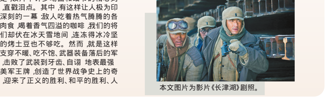
本文图片为影片《长津湖》剧照。

兄弟情、战友情、家国情。从电影塑造那一幕幕令人难忘的英雄群像中，我们能够真切地感受到志愿军将士的英雄气概和他们不畏强敌、制胜强敌的精神意志，全片从头到尾都熔铸着中华民族不畏强暴、维护和平的坚强决心和人民群众深厚的爱国情怀。尤其令人震撼的是，该片中许多场面和细节的精心刻画，直戳泪点。其中，有这样让人极为印象深刻的一幕：敌人吃着热气腾腾的各色肉食，喝着香气四溢的咖啡，我们的将士们却伏在冰天雪地间，连冻得冰冷坚硬的烤土豆也不够吃。然而，就是这样一支穿不暖、吃不饱、武器装备落后的军队，击败了武装到牙齿、自诩地表最强、创造了世界战争史上的奇迹，迎来了正义的胜利、和平的胜利、人