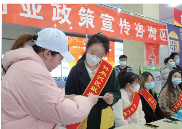
在大型招聘会上为群众解答就业政策。