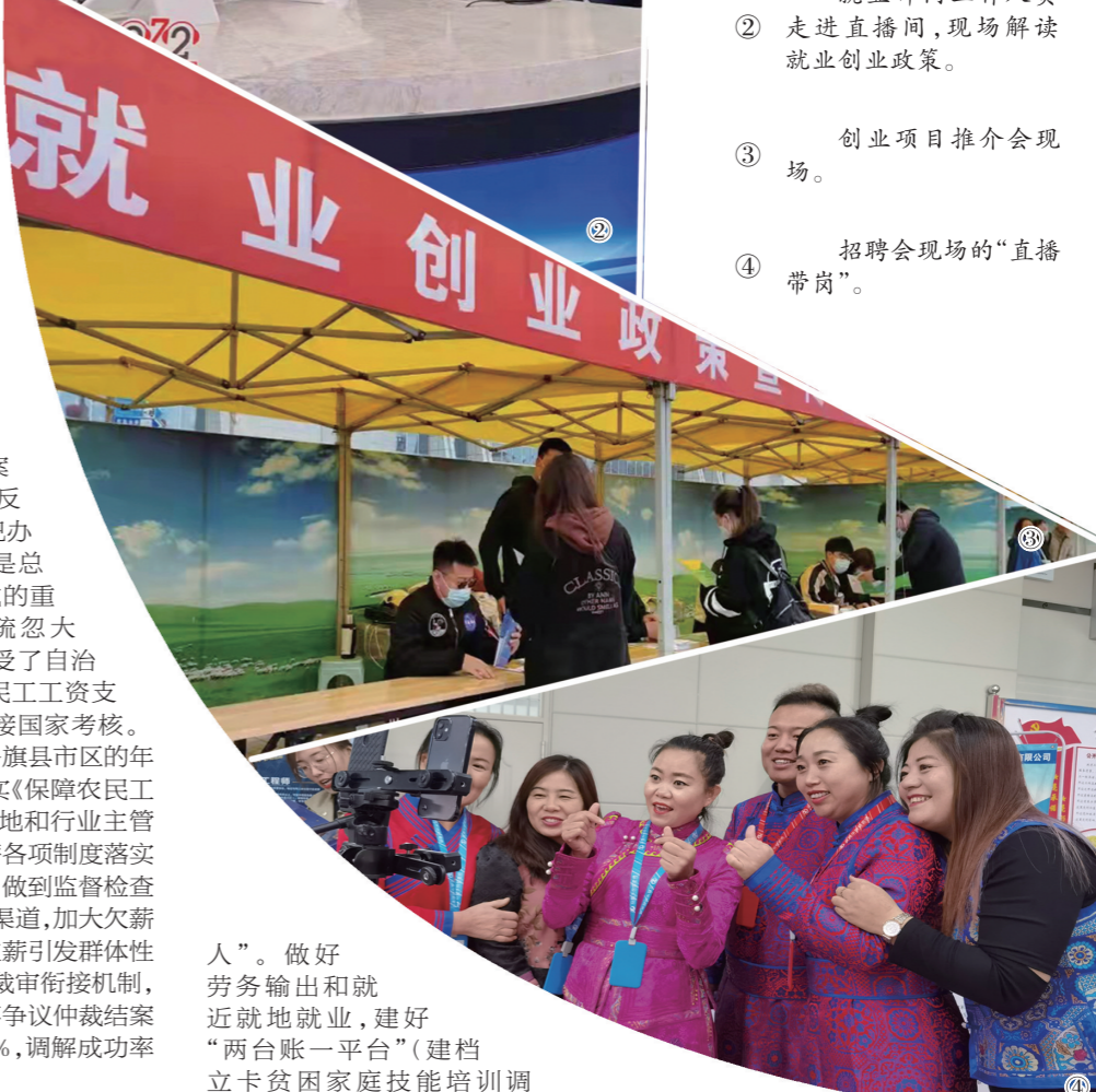
④ 招聘会现场的“直播带岗”。

人”。做好劳务输出和就近就地就业,建好“两台账一平台”(建档立卡贫困户家庭技能培训调查台账、建档立卡贫困户人员技能培训需求受理平台),对有培训意愿的贫困劳动力全部免费培训,提高技术、技能和就业能力。全力推进京蒙劳务协作,搭建有组织劳务输出、促进增收的便捷平台,通过举办5场大型专场招聘会,促进贫困劳动力外出务工增收。始终保持为符合条件的贫困人口代缴保险费和发放待遇动态“双清零”,兜牢民生底线。