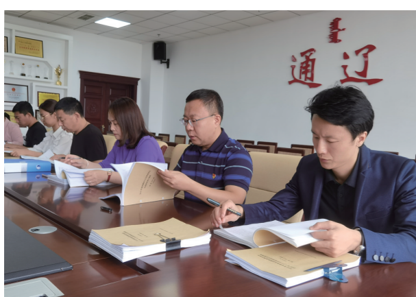
业务人员对社保基金进行监督检查。