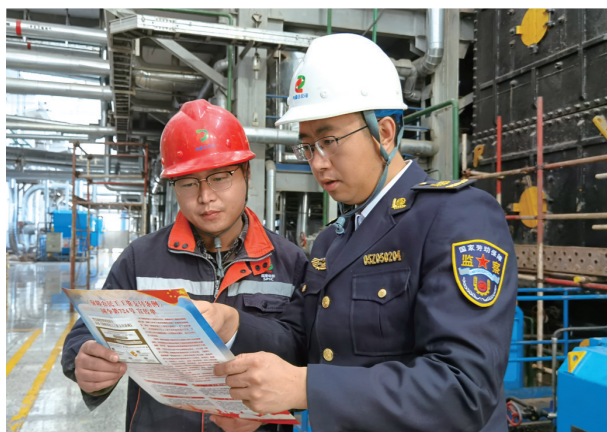
劳动监察工作人员深入企业宣讲合法用工政策法规。