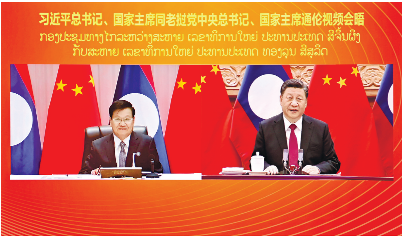
习近平总书记、国家主席同老挝党中央总书记、国家主席通伦视频会晤 ກອງປະຊຸມທາງໄກລະຫວ່າງສະຫາຍ ເລຂາທິການໃຫຍ່ ປະທານປະເທດ ສີຈິ້ນຜິງ ກັບສະຫາຍ ເລຂາທິການໃຫຍ່ ປະທານປະເທດ ທອງລຸນ ສີສຸລິດ