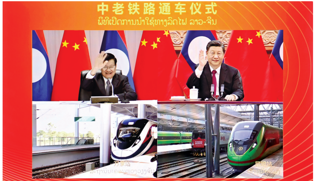
中老铁路通车仪式 ມິທິເປີດການນໍາໃຊ້ທາງລົດໄຟ ລາວ-ຈີນ

12月3日下午，中共中央总书记、国家主席习近平在北京同老挝人民革命党中央总书记、国家主席通伦通过视频连线共同出席中老铁路通车仪式。