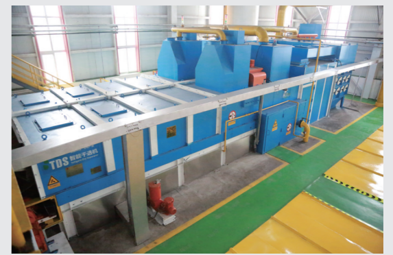
选煤厂智能干选系统。