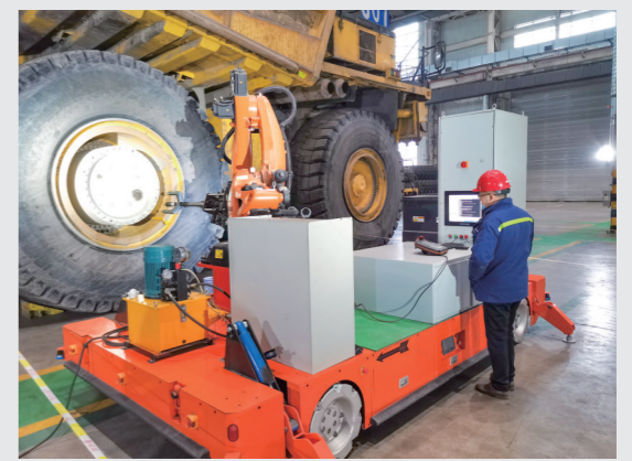
轮胎装卸机器人正在作业。