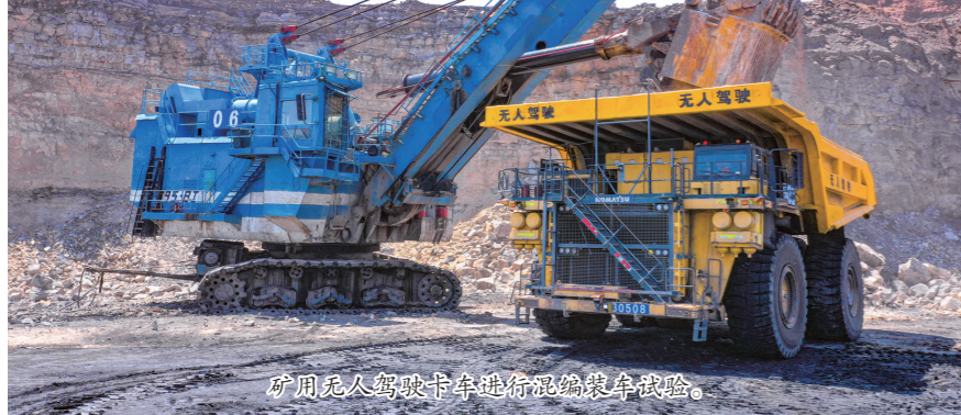
矿用无人驾驶卡车进行物料装车试验