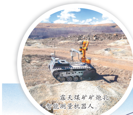
露天煤矿矿地孔智能测量机器人