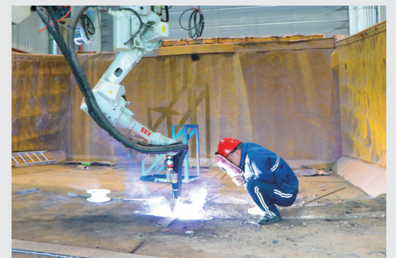
焊接机器人进行焊接作业。