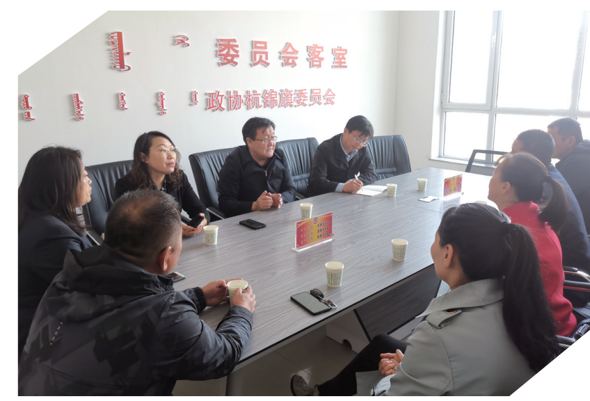
杭锦旗政协委员座谈。