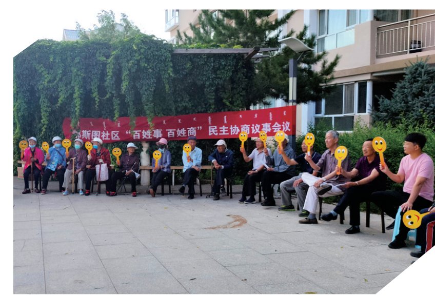
鄂托克旗就宠物管理问题进行基层民主协商。