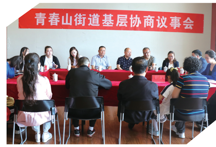
康巴什区青春山街道基层协商议事会现场。

康巴什区根据市政协关于委员之家建设的实施意见,按照“不建机构建机制”的模式,采取两级政协联动共建的方式,与青春山街道珠江社区活动中心设施共用、服务共享,打造形成了集中学习、履职交流、协商议事、教育培训等功能于一体的复合型履职新平台。通过“党组织+模式”,建立了网格、社区、街道协商民主“三级”议事室,制定了三级协商议事工作实施方案,对一些涉及群众切身利益的问题、一些重大疑难事项、涉及公共利益和群众反映强烈的问题进行民主协商,在沟通中达成共识,既解决问题,又增进感情,商量出和谐与凝聚力。 达拉特旗始终坚持以“村(居)民自治、还权于民”,通过民事民提、民事民议、民事民办的形式,进一步夯实村(居)民自治基础,将涉及面广、利益主体多、政策难以全面兼顾的公共事务和村(居)民自治事务,组织各个层面开展广泛充分的协商,让每一位村(居)民成为公共事务的建设者和参与者,实现从“为民做主”到“由民作主”、从“做群众工作”到“由群众做工作”的转变。经过积极探索实践,协商议事室“一组两会”“东河新村”“约四会”“西园社区”“1+3+N”“铜网社区”“一室五会”等各类型、各有亮点的基层协商新模式。 鄂托克旗在不断扩大试点成果,建立政协副主席分别包联和各委办分指导相关苏木镇制度,全程跟踪指导,及时总结经验,确保工作不跑偏、不走样。各苏木镇成立由苏木镇党委副书记兼任主任的苏木镇政协工作联络委员会,作为政协协商向基层延伸的抓手,在同级党委领导和政协指导下,负责驻地政协委员的日常联系和协商议事活动的组织领导工作,有效弥补政协基层工作体制上的不足。 试点经验日趋成熟,协商平台正在实现全覆盖。全市按照“不建机构建机制”的原则和“有活动阵地、有标识牌、有工作场所、有规章制度、有操作模式、有效果评价”的“六有”标准,在不增加基层负担的前提下,依托基层现有的党群协商议事服务中心及会议室、办公室等场所,增加“委员之家”(委员工作室)功能建设,方便委员联系群众,建立协商议事室,作为政协委员密切联系群众和开展协商议事的基本场所,同时鼓励各政协工作基层联络机构在村组、社区、田间地头及生产一线等现场,开展更加灵活务实的协商议事活动。依托各类基层协商议事平台,积极开展“政协机关开放日”“委员值班日”“委员活动日”等形式多样的活动,邀请基层群众、市民代表和社会各界人士广泛参与,逐步探索建立“政协走进群众、群众走进政协”工作新机制。 下一步,鄂尔多斯市政协将探索把委员按照“住所就近、方便参与、发挥优势”广泛协商的原则,编入苏木、乡镇和街道、社区等基层协商议事会,市政协专委会主动加强对基层支持,增强基层一线协商能力,推动实现协商议事平台界别、苏木镇、街道社区“三个全覆盖”,进一步打通政协协商向基层延伸“最后一公里”,作为政协协商向基层延伸的抓手,在同级党委领导和政协指导下,负责驻地政协委员的日常联系和协商议事活动的组织领导工作,有效弥补政协基层工作体制上的不足。