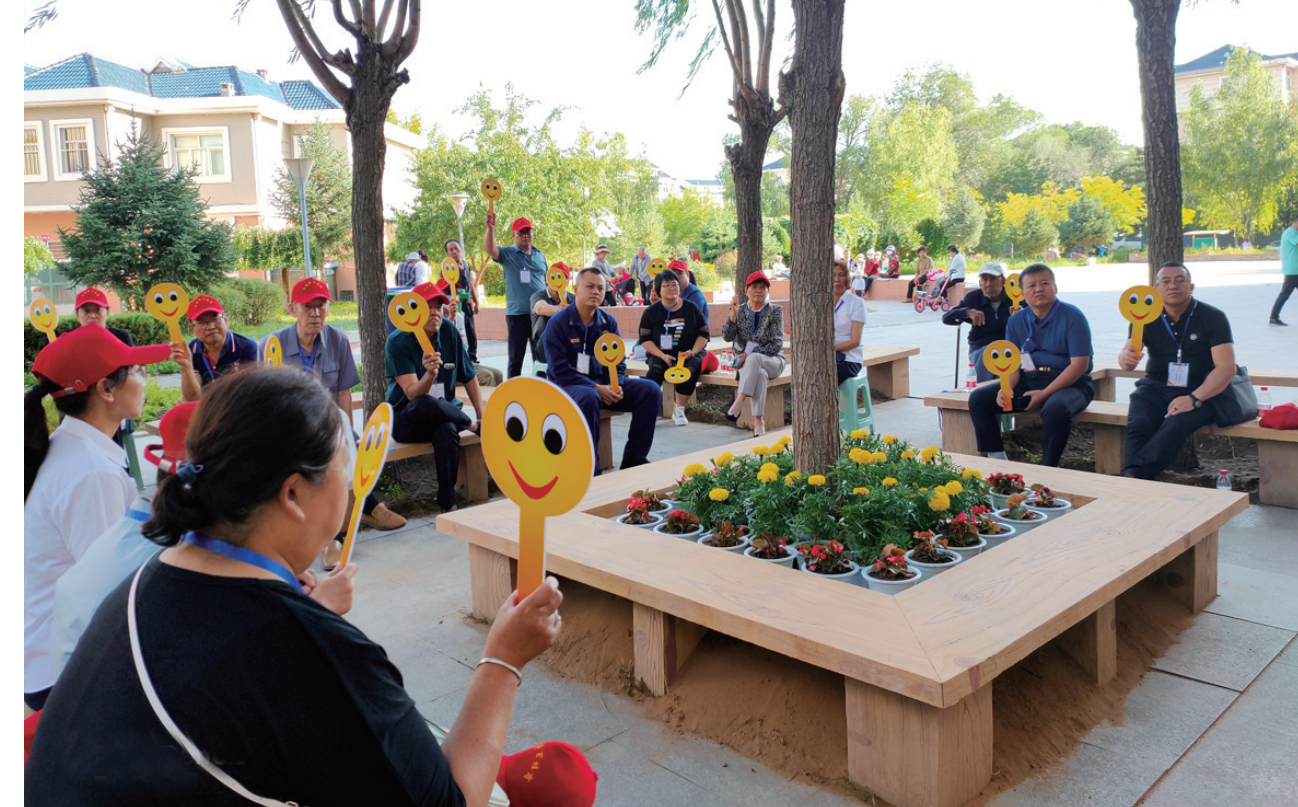
鄂托克旗就小区内公共区域及楼道杂物治理与群众进行协商。