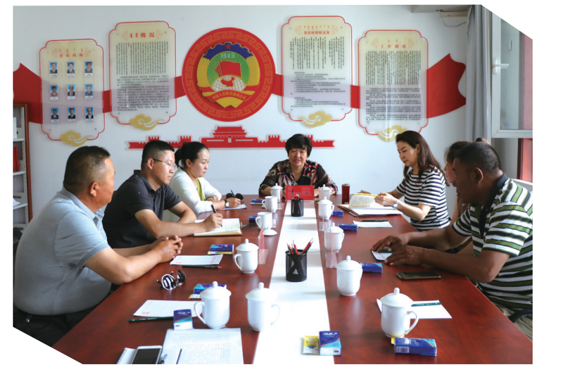
鄂托克旗政协就“城镇化补短板强弱项建设工作情况”与住教办召集委员进行座谈。