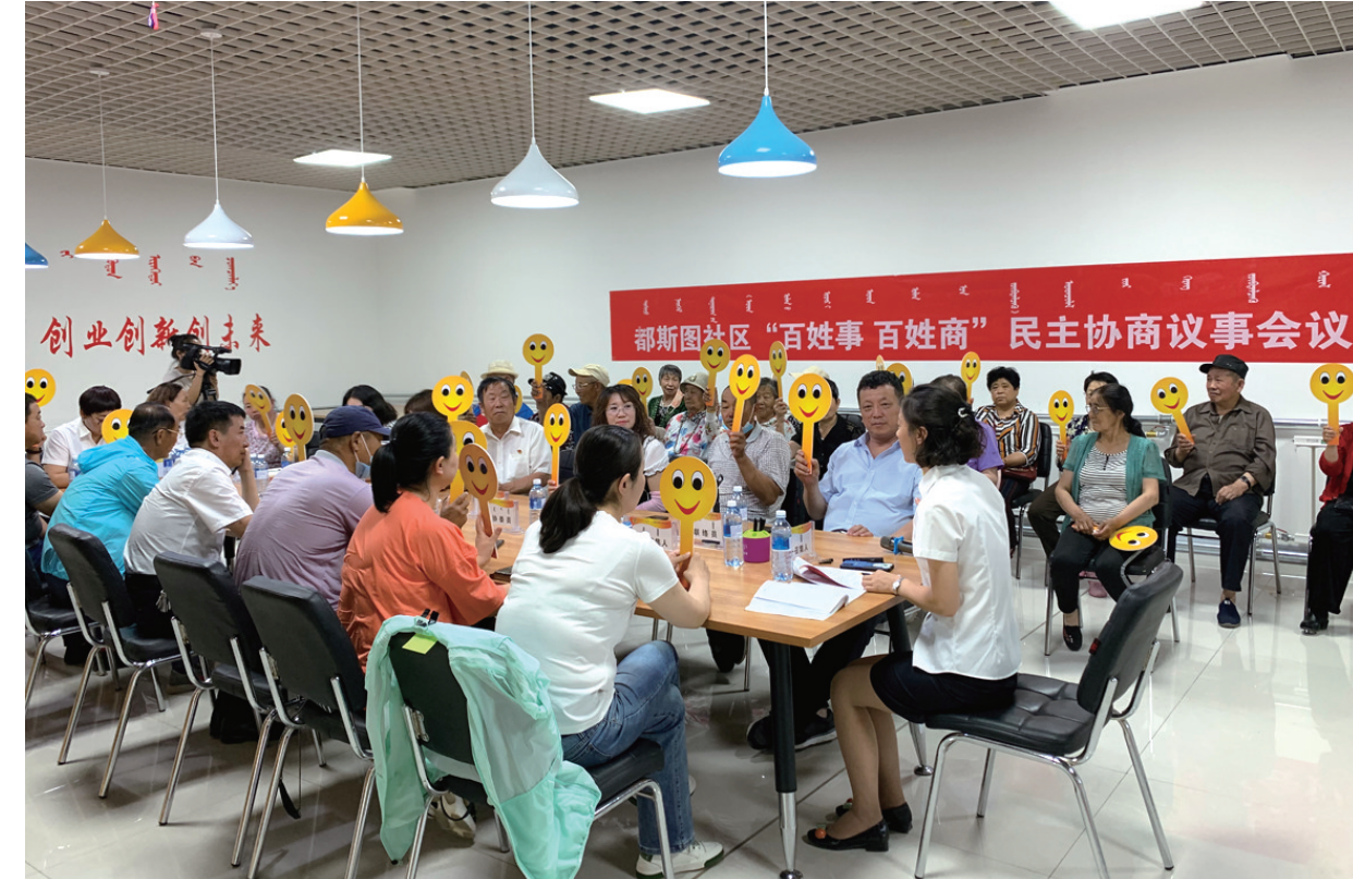
鄂托克旗多方协商解决适用房小区公共座椅问题。