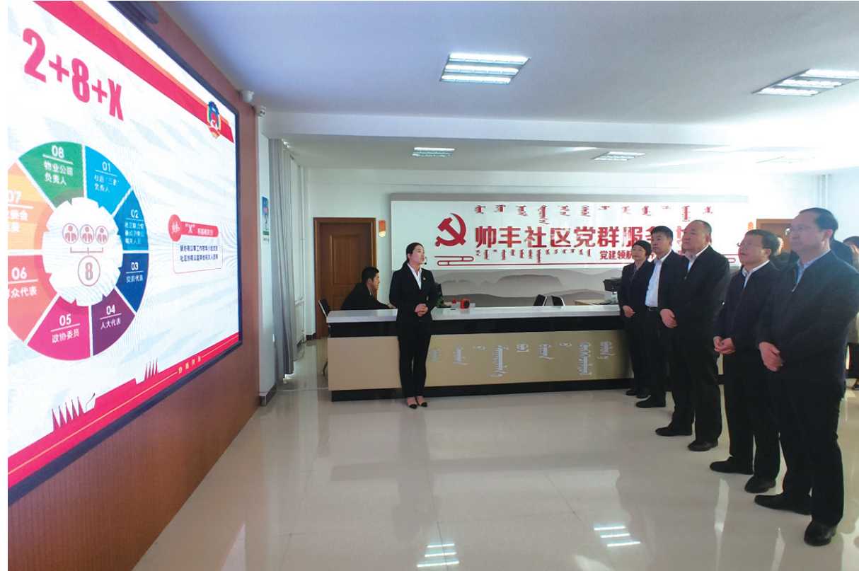
鄂尔多斯市政协商民主向基层延伸工作现场会议期间,与会人员深入康巴什区珠江社区政协委员之家观摩。