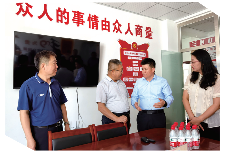
达拉特旗政协调研基层协商民主建设情况。