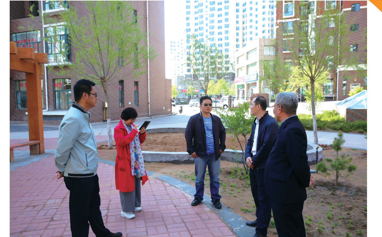
康巴什社区区组议事会期间,工作人员向居民了解情况。