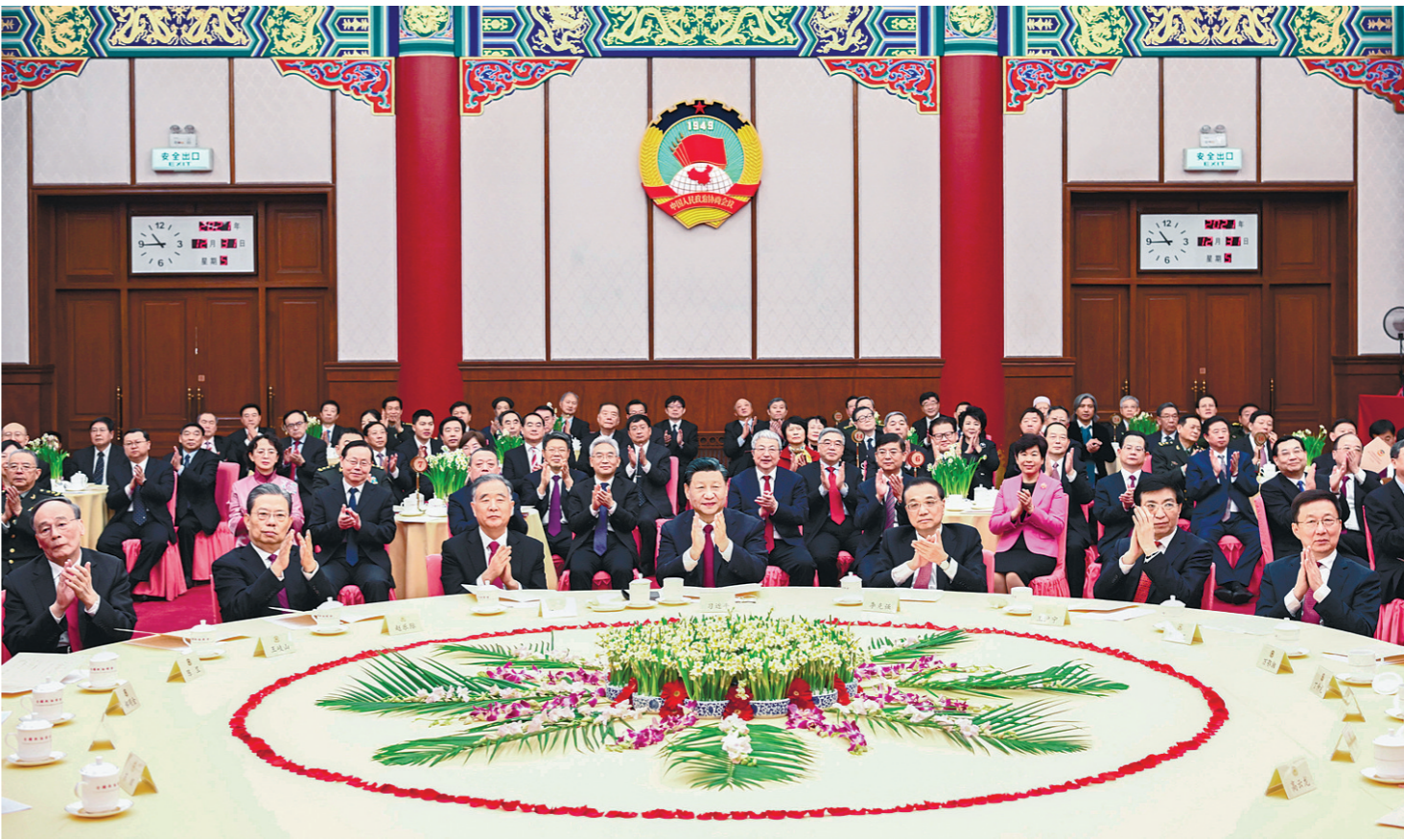
12月31日,全国政协在北京举行新年茶话会。党和国家领导人习近平、李克强、汪洋、王沪宁、赵乐际、韩正、王岐山出席茶话会并观看演出。

习近平强调,2021年,面对复杂严峻的国际形势和艰巨繁重的国内改革发展稳定任务,中共中央团结带领全国各族人民,沉着应对百年变局和世纪疫情,构建新发展格局迈出新步伐,■下转第3版