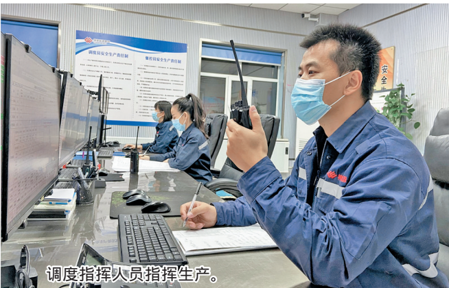
调度指挥人员指挥生产。