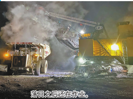
落雪之后还在作业。