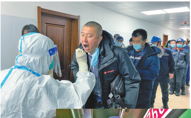
防疫人员在生产区域现场进行核酸检测。