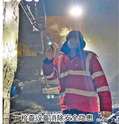
检查设备消除安全隐患。