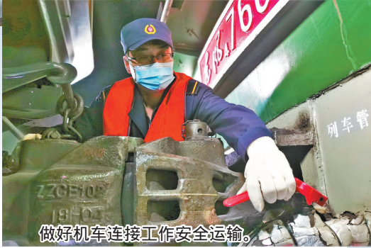
做好机车连接工作安全运输。