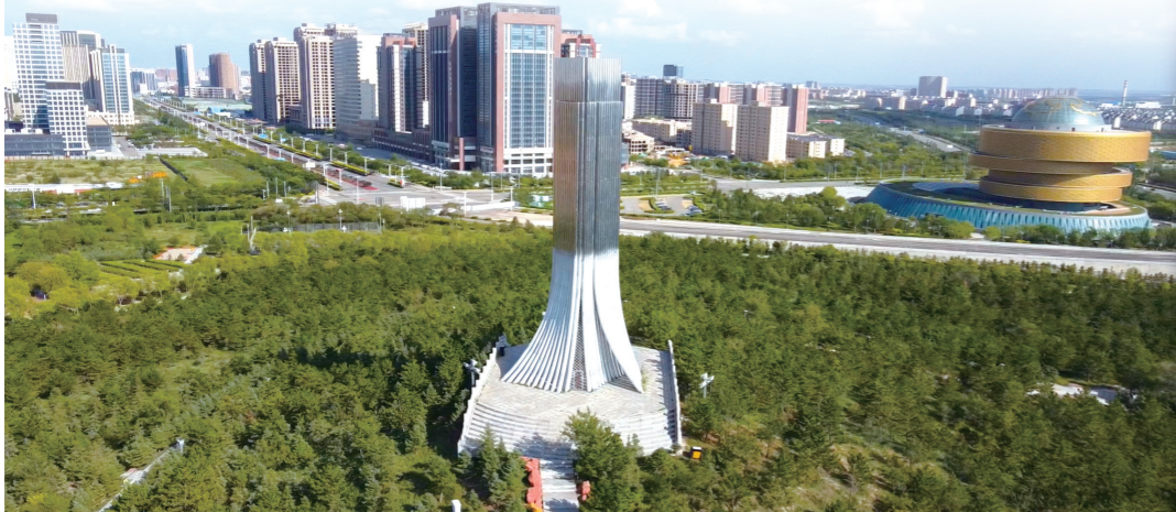
东胜区绿绕城、城披绿。