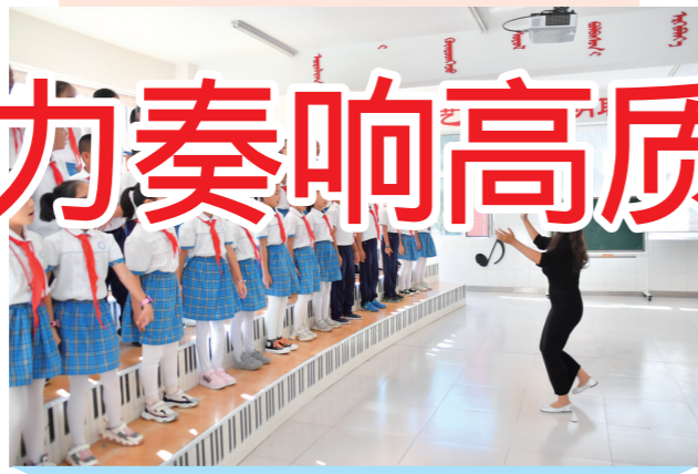
东胜区教育质量居全市前列。