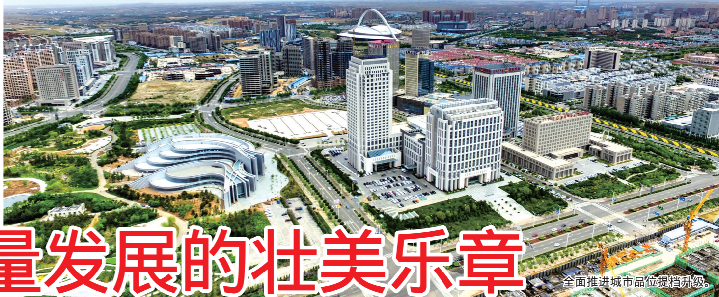
全面推进城市品位提档升级。

站在新的起点,翘首回望,刚刚过去的一年,是鄂尔多斯市东胜区乘势而上、砥砺奋进的一年,是团结一心、厚积薄发的一年,是幸福入怀、文明登攀的一年。57万东胜人沐风栉雨、上下同心,合力奏响高质量发展的壮美乐章。