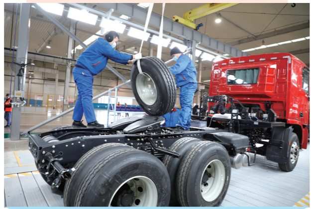
奇瑞新能源重卡项目的落地进一步延长了产业链,助推地区产业升级。