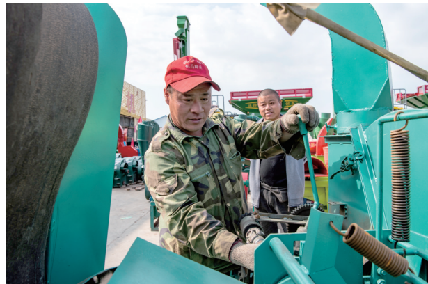
调试农机具。