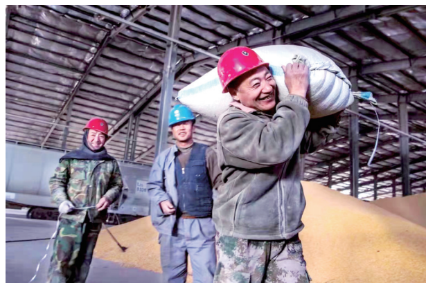
园区工人有力量。吴长虹 摄