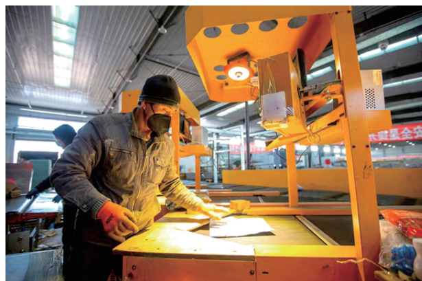
快速扫描快递件。