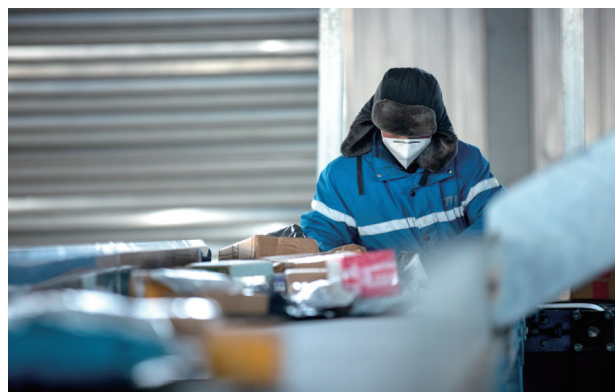
快递员正在分发快递。

伴随着一声嘹亮的汽笛,两列载着钢材、粮食的火车从铁路货场缓缓驶出,运往全国各地。在兴安盟蒙翔物流服务有限公司,顺丰、中通、申通等8家快递企业的10万余件快递在自动分拣机器上精准分拣完后,被配送至千家万户;农副产品批发区车马盈门,前来上货、采买的消费者络绎不绝。1月12日,走进兴安盟物流园区,只见车流穿梭,人来人往,处处是一派繁忙的景象。自2012年建成投入使用以来,兴安盟物流园区已发展成为集综合服务区、建材销售区、汽车贸易区、粮油加工贸易区、农副产品批发区、农牧业生产资料区、配套服务区、仓储配送区、陆路口岸区、生活服务区、发展备用区、铁路货场区12大功能区为一体的兴安盟区域性仓储物流集散中心。