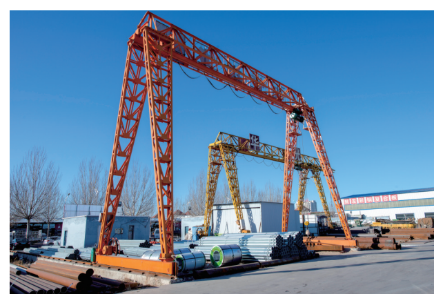
建材销售区。