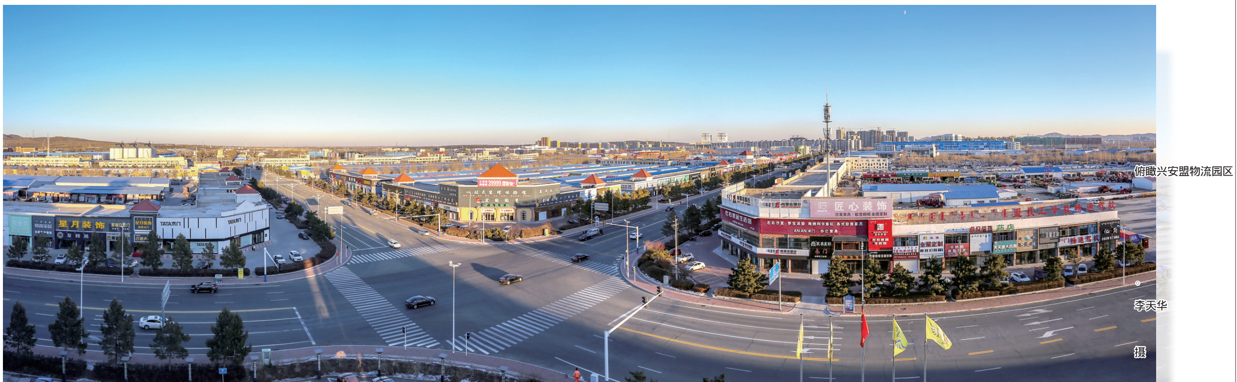
俯瞰兴安盟物流园区