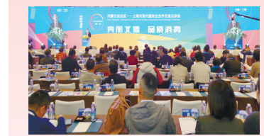
自治区商务厅在上海举办内蒙古自治区上海市现代服务业合作交流洽谈会。