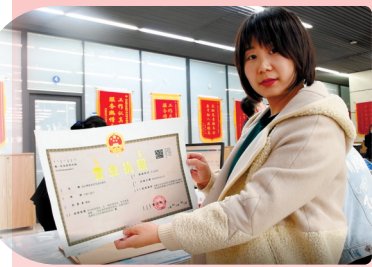
包头市昆都仑区实现一枚印章管审批。商户在展示刚更换的营业执照。