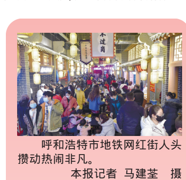
呼和浩特市地铁网红街人头攒动热闹非凡。

过去办理企业信息变更或年审，我们整理的相关资料，要一式三份装订成册，从区商务局开始报送，