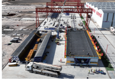
集大原高铁DK11+425察哈尔右翼前旗制梁场。

339.3亿元的集大原高铁线，全长269.6公里，北起乌兰察布站，南连山西忻州市，并由经大同(西)客专线与太原贯通。通车后，将成为内蒙古和晋陕大通道相连的交通骨干线。