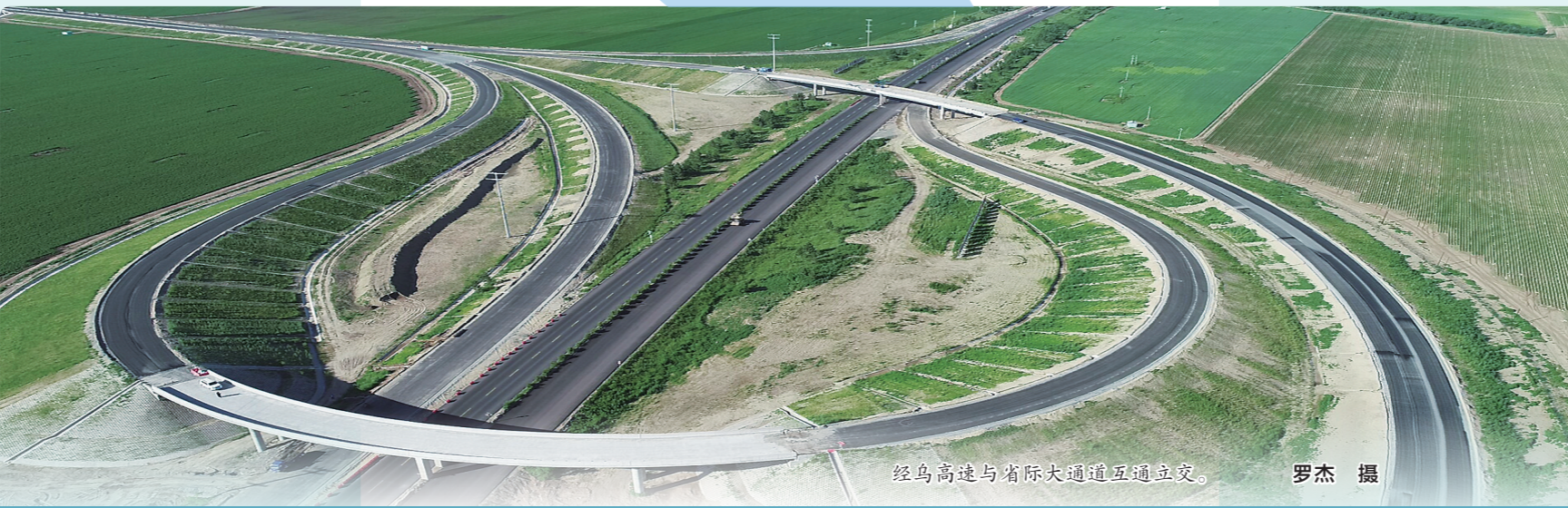
经乌高速与省际大通道互通立交。

此外，自治区交通运输部门全面梳理高速公路出口、服务区等货车集中的点位，会同相关部门在疫情防控检查站点设置“健康码申诉站”，畅通货车司机健康码申诉绿色通道。针对拥堵缓行问题，我区建立了24小时实时报送机制，目前全区249个高速公路收费站、126对服务区全部正常运行。