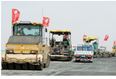
二赛高速公路路面施工现场。