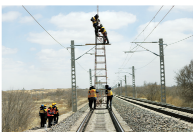
集通铁路电气化扩能改造进行接触网架设作业。