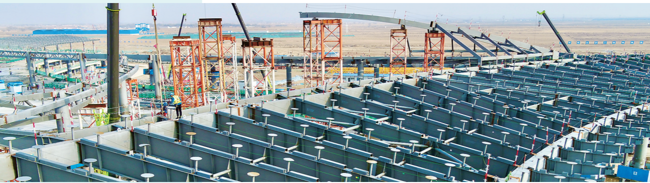
呼和浩特新机场建设稳步推进。

与此同时，乌海市财政多措并举，不断提升地方经费保障与管理能力，全力做好基层“三保”工作——建立节约型财政保障机制，优化支出结构，严控一般性支出，厉行勤俭节约，确保“三保”支出预算足额安排；将绩效评价结果作为基层运转、基层民生项目编制的重要依据，让每笔资金账目可查、来源清晰；争取各类资金保障基层运转及民生等公共服务正常运行，今年一季度乌海市财政争取各类转移支付资金22.75亿元，同比增长24%；严格“三保”预算执行，直达资金使用管理，有效提高“三保”资金使用效益。