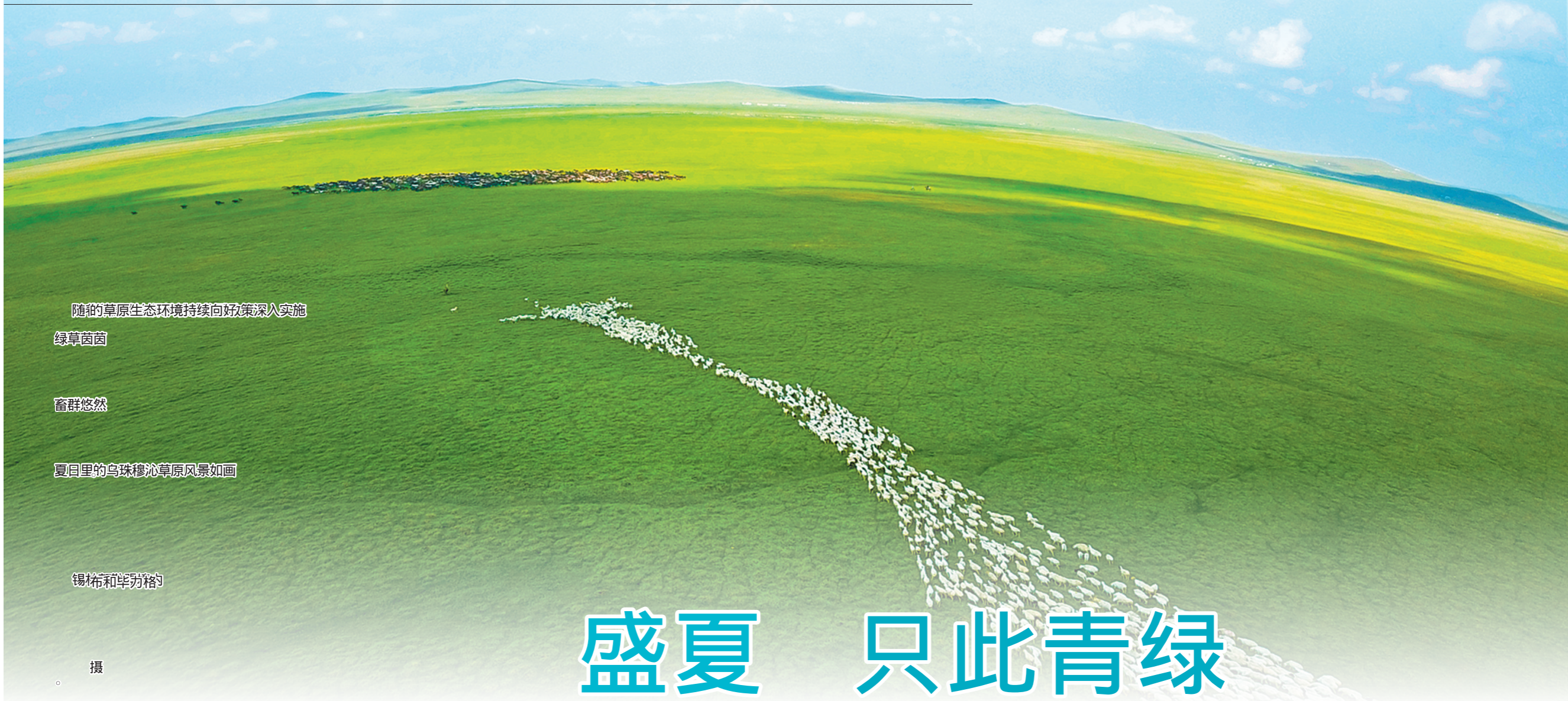
随的草原生态环境持续向好策深入实施