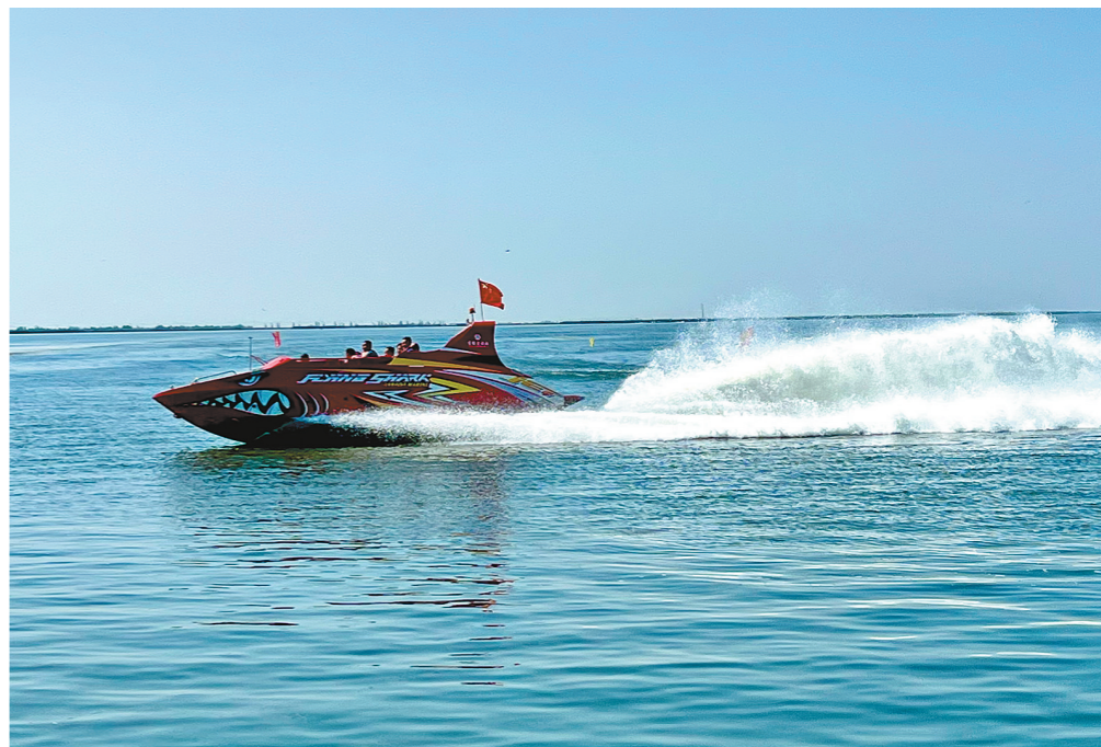
游客在乌梁素海乘快艇游玩。随着生态治理的深入推进,乌梁素海水质得到全面改善,吸引了大量的鸟类栖息和繁殖,鱼类的品种和数量也明显增加,成为人们观赏游玩、怡情怡性的好去处。