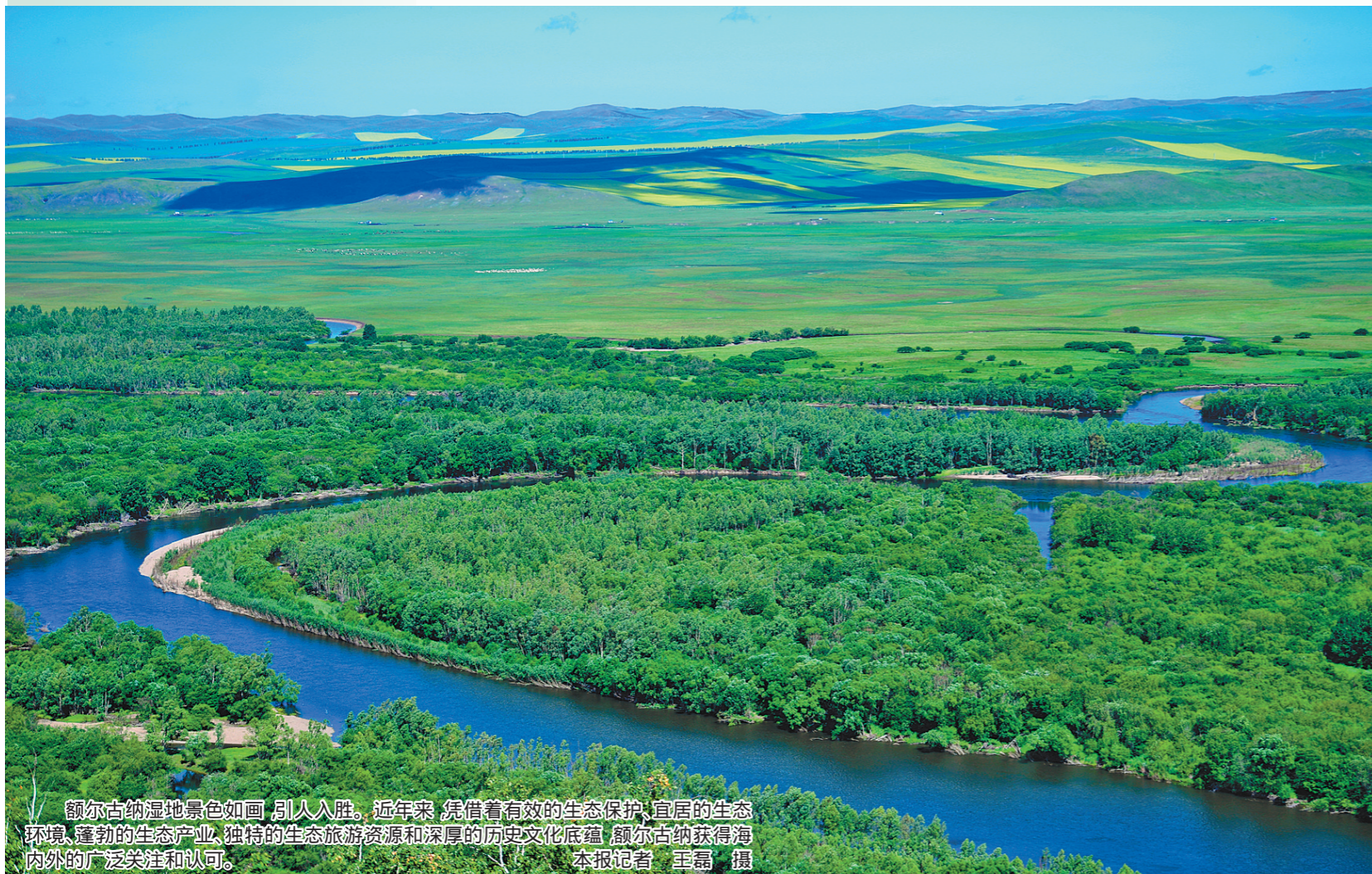
额尔古纳湿地景色如画,引人入胜。近年来,凭借着有效的生态保护,宜居的生态环境,蓬勃的生态产业,独特的生态旅游资源和深厚的历史文化底蕴,额尔古纳获得海内外的广泛关注和认可。