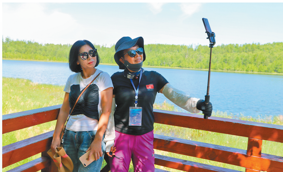
游客在阿尔山旅游景区感受自然的魅力。阿尔山市的森林覆盖率达86%,蓝天白云与青山绿水相映成趣,迷人的景致吸引着众多游客。

行走在青绿之间是一种享受,不仅仅是视觉上的盛宴,更能感受到青绿背后的力量,与有荣焉的自豪感也会油然而生。有人说,一生一定要去一次内蒙古,不为他人,只为自己。趁时光正好,来内蒙古吧!