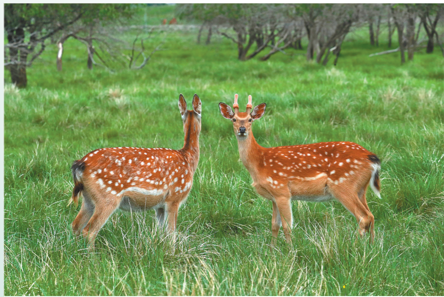
乌兰布统草原风光秀丽,植被丰富,优良的环境和丰富的食物链,吸引着梅花鹿在此安家。