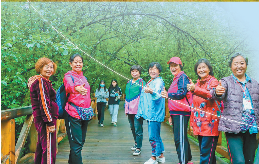
兴安盟乌兰浩特市的神骏湾生态旅游体验区内热闹非凡。本报记者 高敏娜 摄