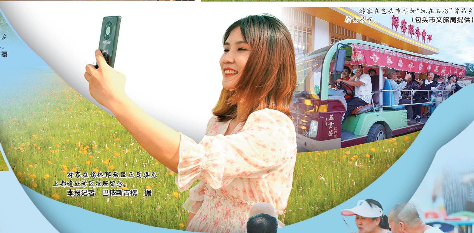
游客在锡林郭勒盟正蓝旗九上庙景区拍照留念。