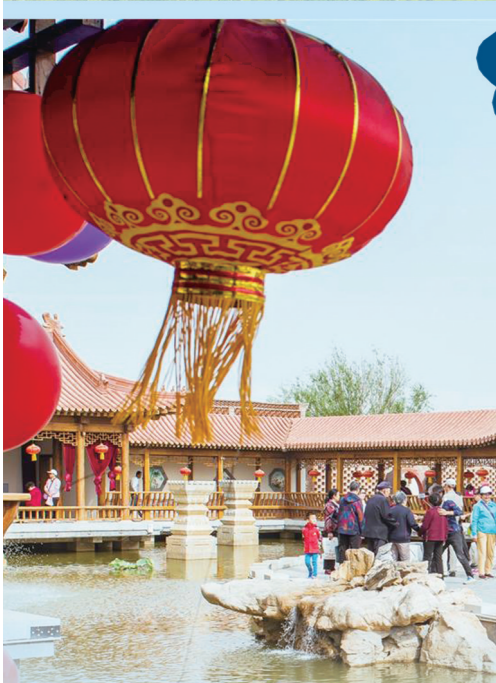
全国最美乡村巴彦淖尔市临河区狼山镇富强村。