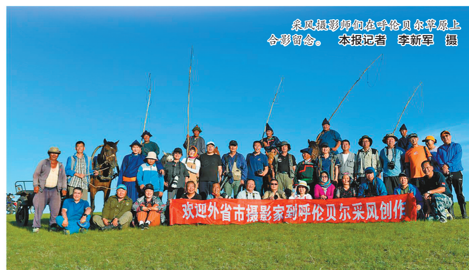
采风摄影师们在呼伦贝尔草原上合影留念。