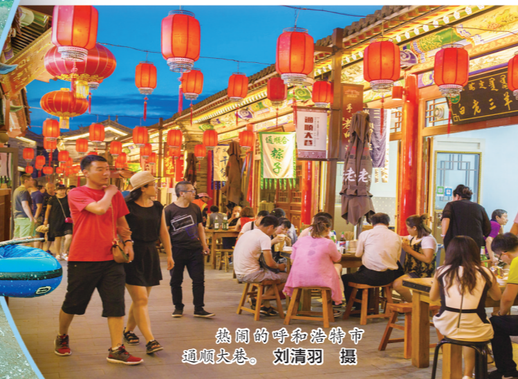
热闹的呼和浩特市通顺大街。