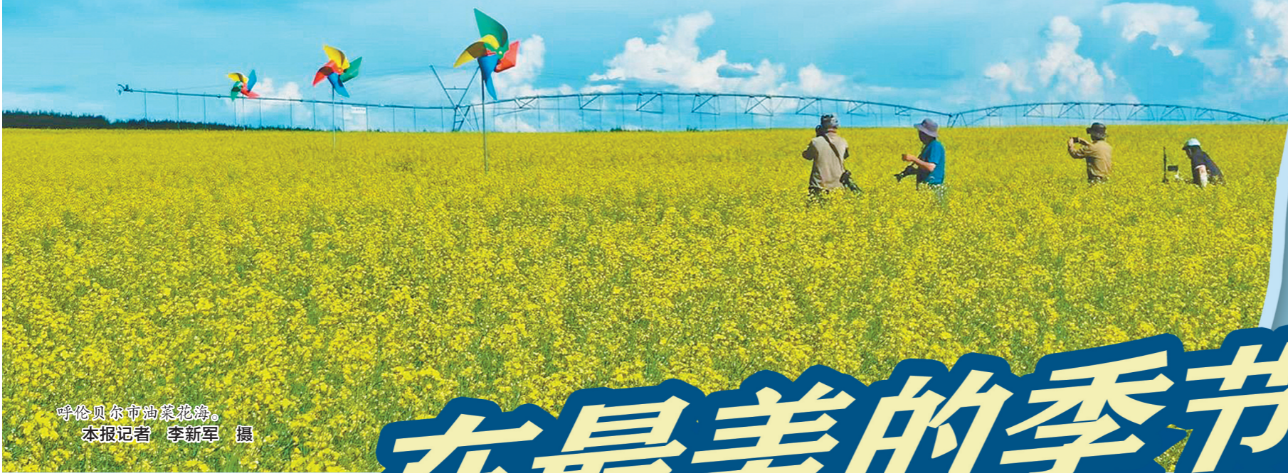
呼伦贝尔市油菜花海。