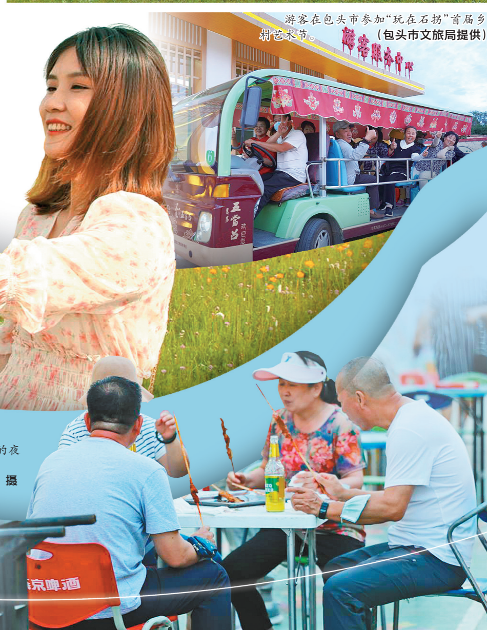
外地游客在乌海的夜市中享受特色美食。