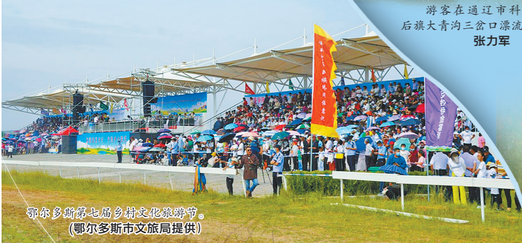
鄂尔多斯第七届乡村文化旅游节。