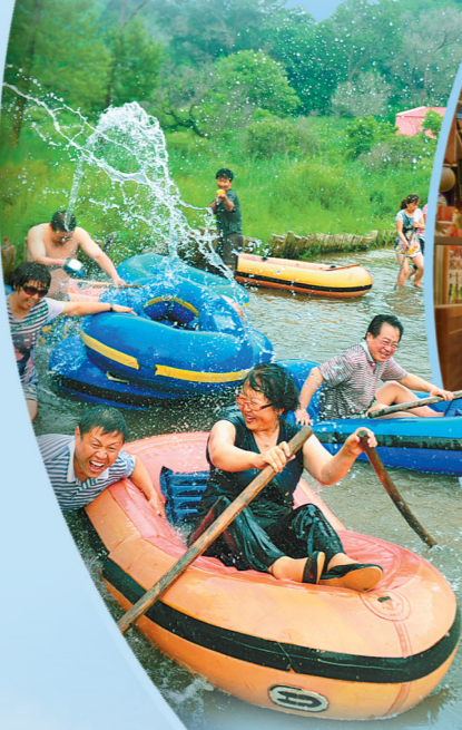
游客在通辽市科左后旗大青沟三岔口漂流。

7月是内蒙古一年中水草最丰美的时节,全国各地的游客纷纷打卡内蒙古各大旅游景区。东有苍莽林海,中有浩瀚草原,西有广袤大漠,内蒙古大草原呈现出最美的打开方式。风情体验、美食品鉴、考古探秘、乡村度假,让游客体验到丰富多彩、独具特色的草原魅力。在这里你不用刻意寻找景点,因为沿途就是最美的风景;在这里你不会感到拥堵和嘈杂,因为草原有最宽阔的胸怀和无边的视界。这个季节在内蒙古,能感受辽阔的绿、炙热的红、烂漫的黄、浩瀚的蓝。总之,多彩交织,风景独好! 来内蒙古吧!在最美的季节,让我们一起看草原。