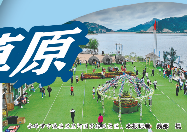
赤峰市宁城县黑里河国家级风景区。