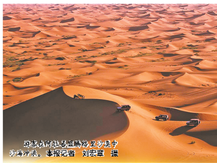
游客在阿拉善盟腾格里沙漠中沙漠冲浪。

7月是内蒙古一年中水草最丰美的时节,全国各地的游客纷纷打卡内蒙古各大旅游景区。东有苍莽林海,中有浩瀚草原,西有广袤大漠,内蒙古大草原呈现出最美的打开方式。风情体验、美食品鉴、考古探秘、乡村度假,让游客体验到丰富多彩、独具特色的草原魅力。在这里你不用刻意寻找景点,因为沿途就是最美的风景;在这里你不会感到拥堵和嘈杂,因为草原有最宽阔的胸怀和无边的视界。这个季节在内蒙古,能感受辽阔的绿、炙热的红、烂漫的黄、浩瀚的蓝。总之,多彩交织,风景独好! 来内蒙古吧!在最美的季节,让我们一起看草原。