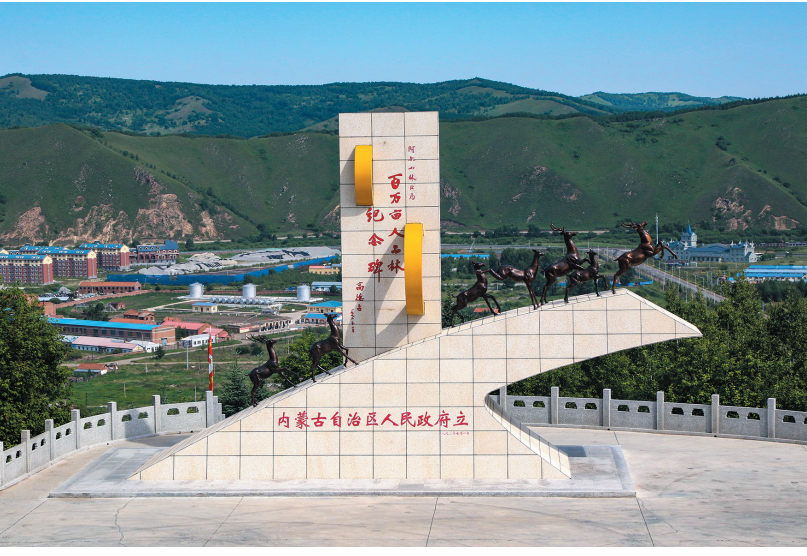
阿尔山百万亩人工林纪念碑。刘志军 摄

这几年,林区的天越来越蓝了,水越来越清了!空气呼吸起来顺心,职工收入放心,日子过得越来越开心!旅游产业不断发展,日子过得更舒心!林区干部职工用心、动脑、力行,以尺寸之功积千秋之利,才能不负青春、不负时代、不负人民。作为“绿水青山”的守护者,从林区开发建设初期到天保工程启动实施,从全面停伐到开启生态文明建设新篇章,内蒙古大兴安岭始终将森林防火作为保生态的总引擎,紧紧围绕“四要”要求,强预防、补短板、控风险、提能力,聚焦“早、细、实、快、早”看住人、管住火、防住雷,实现了“不发生火灾,不发生人员伤亡,不发生影响较大自然火灾,不发生人员伤亡事故”的工作目标,最大限度减少了森林资源损失。目前,林区已有效建立了预防、扑救、保障三大体系,形成天地一体化防灾减灾体系,推动人防向技防转变,将互联网+普查系统广泛应用于森林防火各个环节,织密织牢森林火灾防控网。