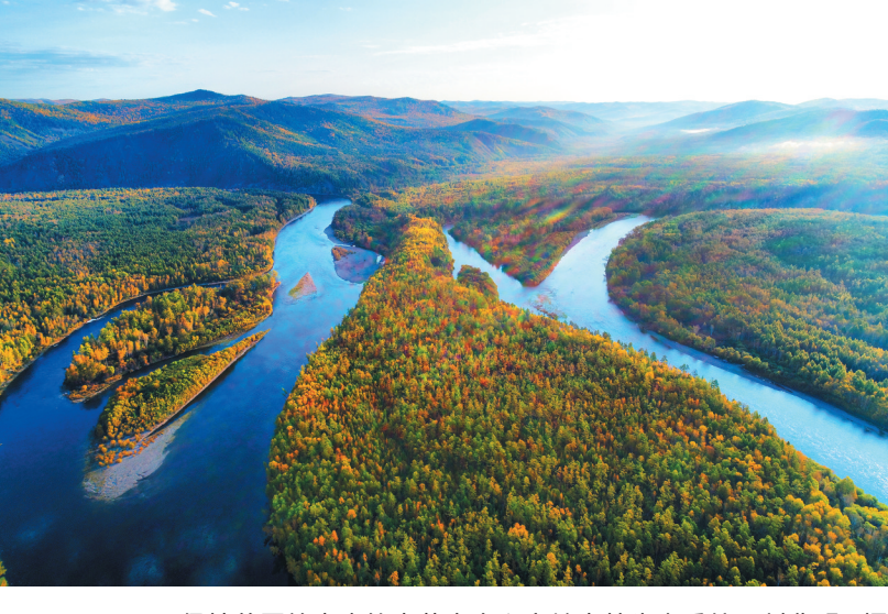
保持着原始本真的内蒙古大兴安岭森林生态系统。