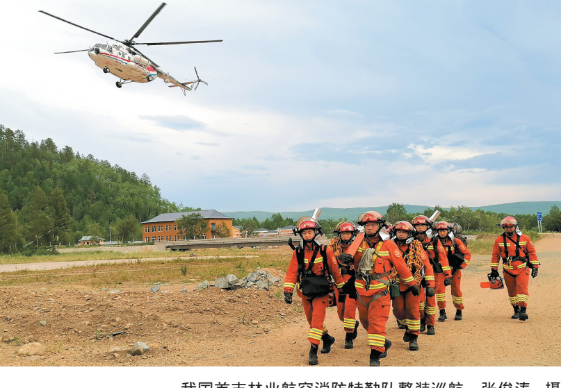
我国首支林业航空消防特勤队整装巡航。张俊涛 摄