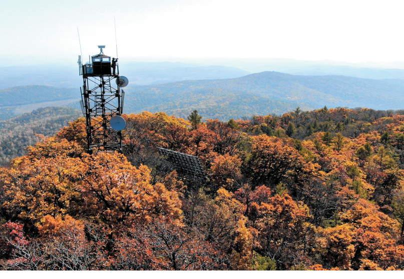
森林火灾扑救。