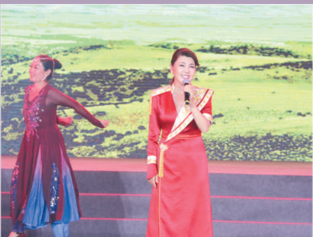
歌曲《站在草原望北京》《画你》。演唱:乌兰图雅