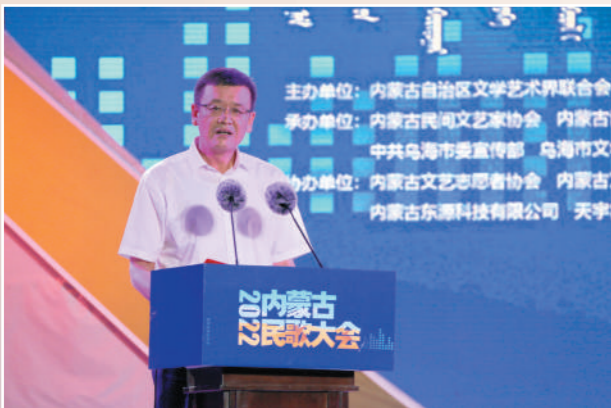
乌海市委副书记、市长杨进致欢迎辞。