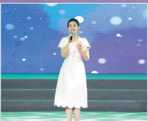
歌曲《白云的故乡》《草原相思曲》。演唱:刘洛君