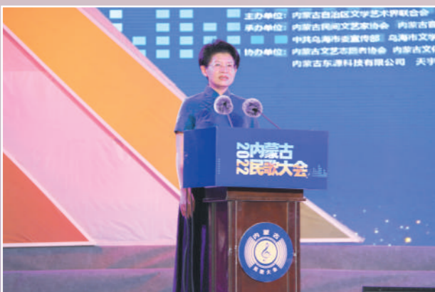
内蒙古自治区文联党组书记、主席冀晓青宣布民歌大会开幕。