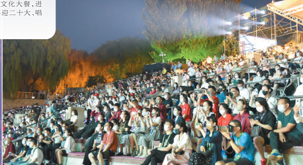
精彩的节目让观众如醉如痴。