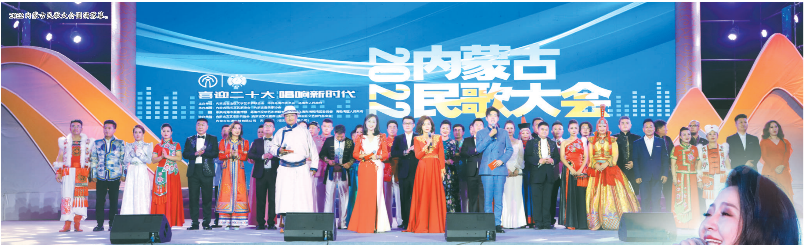
2022内蒙古民歌大会圆满落幕。