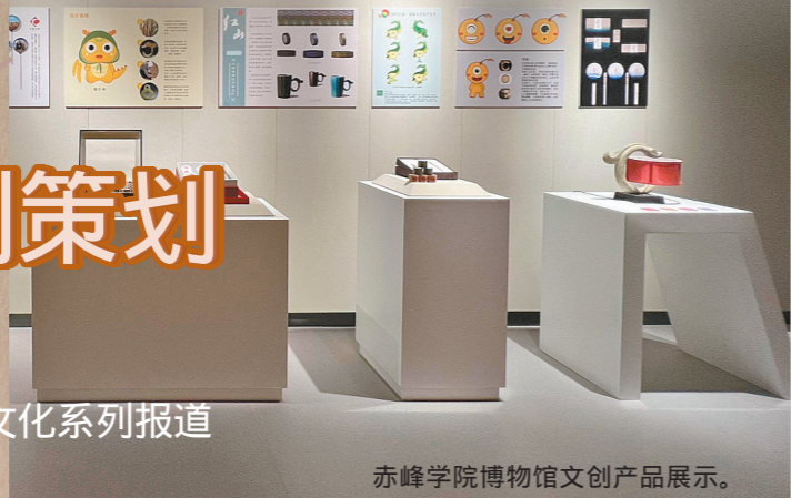
赤峰学院博物馆文创产品展示。

红山文化坛庙家,中华文明一象征。 从古文化到古城,再到古国,是一个漫长的历史发展过程。 历经1500年,红山古国不但没有淹没在历史的烟云中,还创造出了辉煌的文明始源,着实令人赞叹。 红山文化所创造的文明成就或深埋于地下,或展陈于博物馆,或隐藏于未知的角落。 时至今日,我们仍然没有完全了解它,但想要走进它的初心却从未改变。