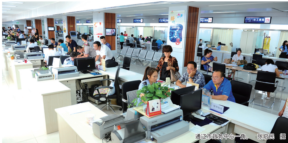
通辽市政务中心一角。

优化企业开办服务。企业登记、刻制印章、申领发票及税控设备、企业员工参保登记、住房公积金企业缴存登记等开办事项集成整合,全市企业开办0.5个工作日内办结,营业执照、印章、发票和税控设备实现线下一窗领取。推进工业园区区域评估。截至目前,全市62项区域评估事项已全部完成,完成率100%。评估成果全部公开,并汇聚工程建设审批系统。同时已印发《区域评估成果互认共享工作的指导意见》并明确开展评估事项清单、负面清单。