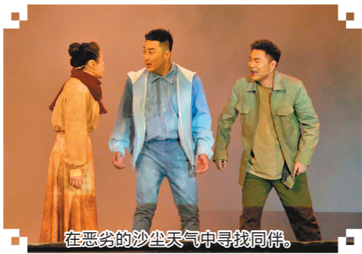
在恶劣的沙尘天气中寻找同伴。