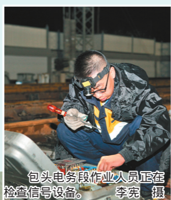
包头电务段作业人员正在检查信号设备。