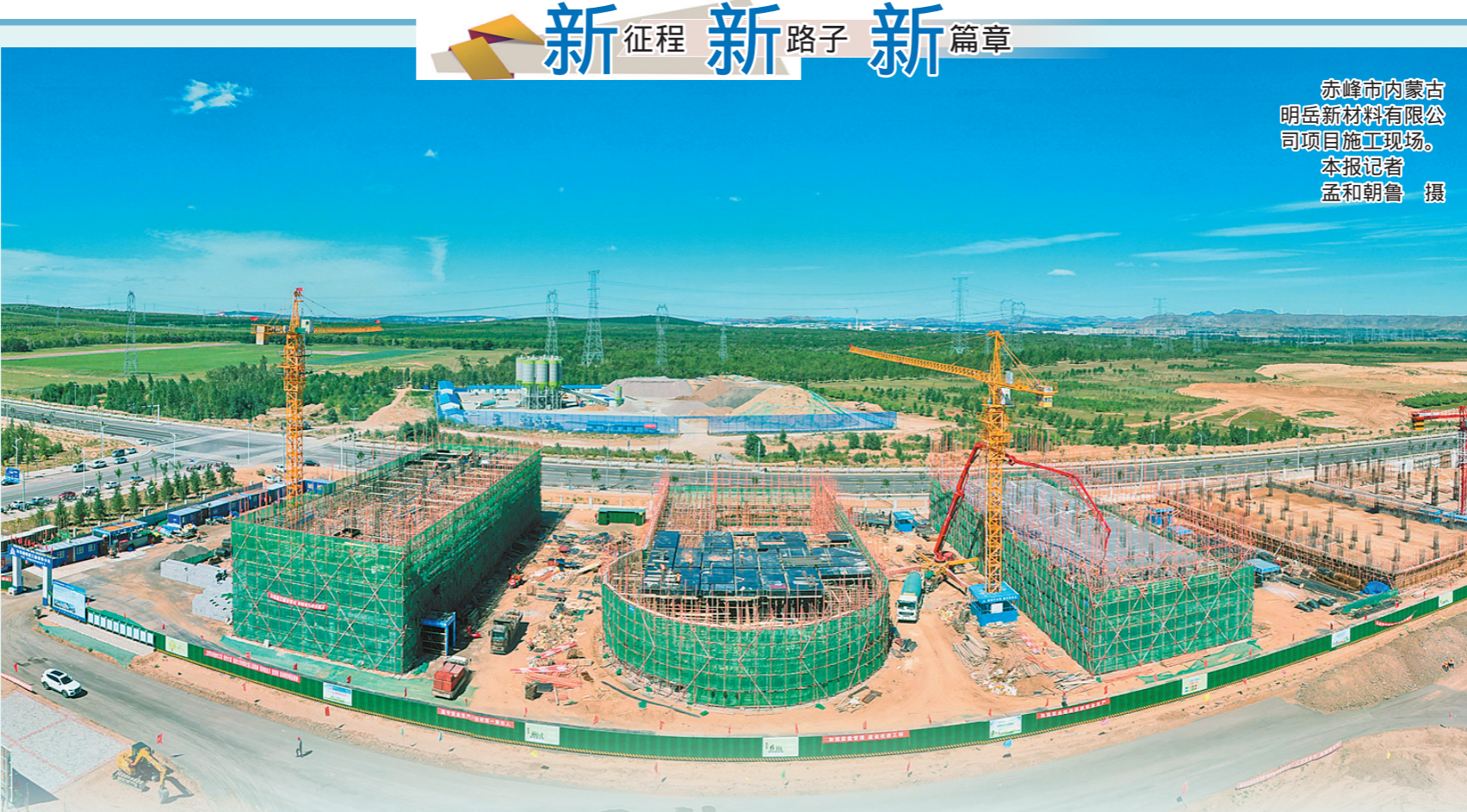
赤峰市内蒙古 明岳新材料有限公司 项目施工现场。

在跨地区、跨部门知识产权保护协作方面,至2021年底,自治区市场监管局(知识产权局)先后与北京、天津、河北、山西等13个省市区签署知识产权保护合作协议,与自治区公安厅等部门建立知识产权保护协作机制,全区12个盟市知识产权局共同签署知识产权保护协作机制初步建立。