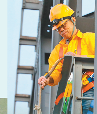
乌海工务段作业人员雨后用流速仪采集黄河水文信息。