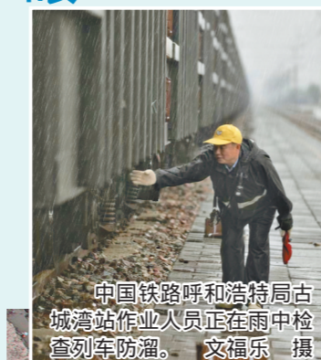
中国铁路呼和浩特局古城湾站作业人员正在雨中检查列车防溜。

铁路工务系统各单位严格执行雨量警戒制度和桥梁洪水水位警戒制度,紧盯防洪看守地段、桥梁等重点处所,密切监视水情和设备状态,全力开展水害抢险。调度系统及时掌握沿线预警警戒值和实时雨量,果断发布调度命令,指挥列车限速运行、临时停车和封锁区间。机务系统机车乘务员加强瞭望和车机联控,情况不明即减速慢行,发现险情立即停车。8月份,铁路部门共克服5轮较大区域降雨影响,发送煤炭1499.45万吨,有力保障了京津冀、东北和华东等地的能源需求。