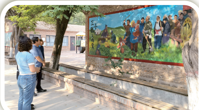
巴音陶亥镇手绘“三孤儿入内蒙”宣传墙吸引人们驻足围观。陈洋 摄