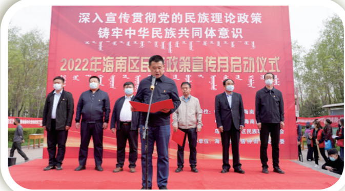
海南区启动“民族政策宣传月”。

同时,该区始终将民族团结进步创建工作纳入重要议事日程,成立了海南区创建全国民族团结进步示范区工作领导小组,制定了《海南区推进创建全国民族团结进步示范区工作实施方案》,将机关、镇(街道)、社区、企业、学校、连队、宗教活动场所作为创建工作的主阵地,形成以点串线、以线连片、以片带面的示范创建格局。先后创建各级各类示范单位、集体48个,获评模范个人83人,通过发挥典型辐射带动效应,全区上下各具特色的创建活动蓬勃发展,民族团结进步理念在社会各个细胞、各族群众生产生活中充分体现,深深扎根。