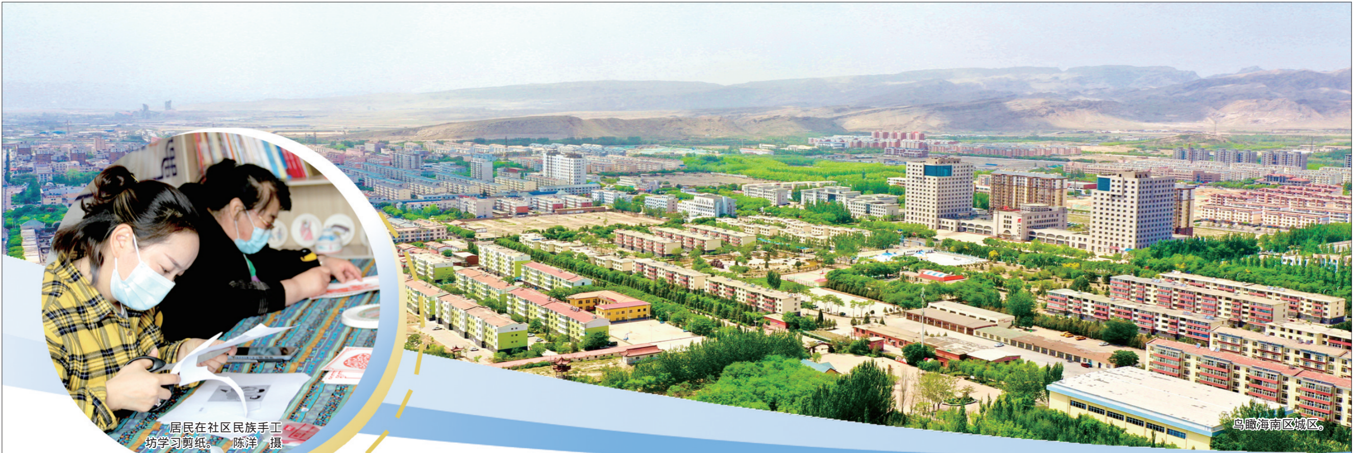
居民在社区民族手工坊学习剪纸。