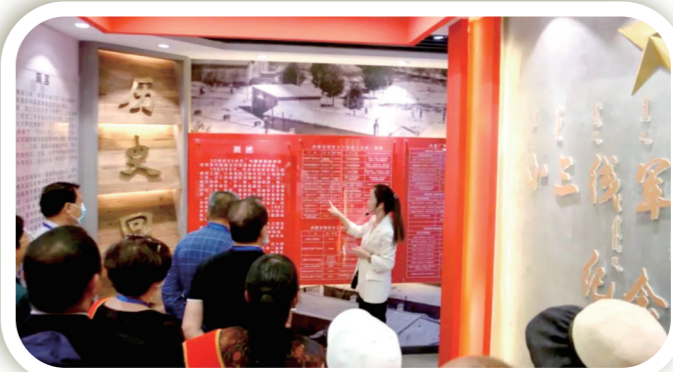
参观海南区小三线军工文化纪念馆。

该区还积极探索民族地区村民议事会、村民理事会等协商形式,严格落实“四议两公开”532工作法等民主议事决策制度,乡村民族关系更加和谐稳定。巴音陶亥镇万亩滩村成功入选全国村级议事协商创新实验试点单位。2018年以来,全区调解组织共调解案件2775件,成功2760件,调处成功率始终保持在98%以上,群众安全感满意度达99.6%,位居全市第一。