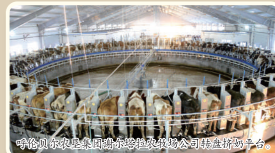
呼伦贝尔农垦集团满州里分公司转盘挤奶平台。