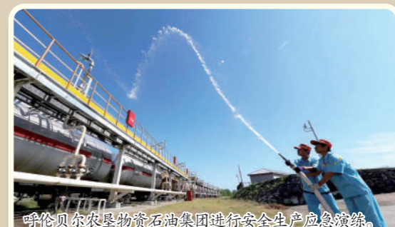
呼伦贝尔农垦物资石油集团进行安全生产应急演练。