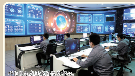
呼伦贝尔农垦集团信息中心。

油杂粮板块示范区、岭南五场粮油板块示范区、谢尔塔拉三河牛产业园区、哈达图呼伦贝尔羊产业园区、三河马产业园区5个示范区。围绕一二三产业融合发展,谋划补齐深加工短板。向绿而生,因绿而兴。绿色农牧业是呼伦贝尔农垦最大的特色和优势,这里的田野富有色彩,留得住乡愁。呼伦贝尔农垦集团致力于守护好绿水青山的“颜值”,利用好金山银山的“价值”,不断开辟垦区绿色崛起的新模式,寻找传统农牧业和现代生活的连接点。发展路径生态为基,发展之路绿色为底,创新发展、协调发展、绿色发展、开放发展、共享发展,向着“创国际一流品质、创国内一流品牌”的“双十、双百、双创”目标展开追逐梦想的画卷,为垦区现代化建设展现出十足张力。展望未来,呼伦贝尔农垦集团一定能在高质量发展的轨道上行稳致远。