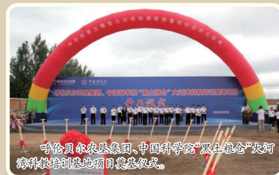
呼伦贝尔农垦集团、中国科学院“黑土粮仓”大河湾科技培训基地项目奠基仪式。

响天气等手段,提升了防灾减灾能力。保护性耕作技术年均推广面积在200万亩以上,增强了土壤防风保墒能力。让新老农垦人想都不敢想的75台植保及监测用无人机,更是大大提升了垦区航化植保能力。让人情不自禁地想起2021年集团公司为485.82万亩农作物上的农业保险,占到播种面积的84%。这一切,不仅仅是农业生产上的“双保险”。如今,垦区80%以上耕地实行集中统一耕种管理。2021年,垦区播种579.1万亩,作物总产40.43亿斤,其中,粮油总产23.64亿斤。源源不断的绿色粮食装满了中国粮仓!