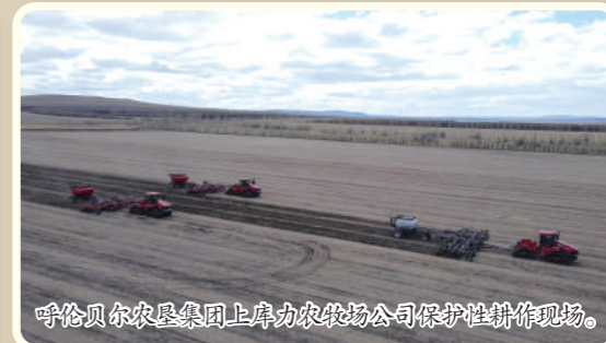
呼伦贝尔农垦集团上库力农牧场公司保护性耕作现场。