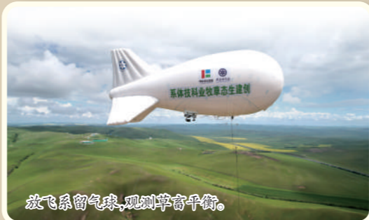
放飞系留气球,观测高空干旱。