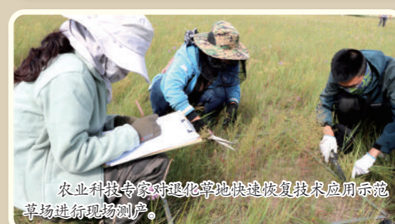
农业科技专家对退化草地快速恢复技术应用示范草场进行现场测产。