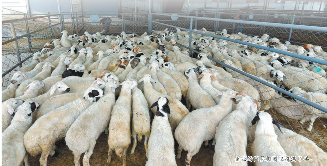
企业的简易棚圈内挤满了羊。

在今年的牲畜出栏季,锡林郭勒盟积极推动组织化出栏工作,针对当前新冠肺炎疫情防控的关键时期,早谋划、早部署、早行动,动员各旗县、苏木镇、嘎查村积极联动,通过加大宣传力度、实施草原生态保护补助奖励等形式,让牧民群众明白“减畜就是出栏,出栏就是致富”的道理。同时,不断强化牧企联结机制,多措并举引导牧民抢抓出栏“黄金期”,早出栏、快出栏,在加大牲畜出栏力度的同时,确保草畜平衡、政策落实到位。