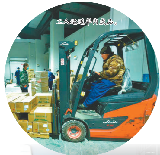
工人运送羊肉成品。