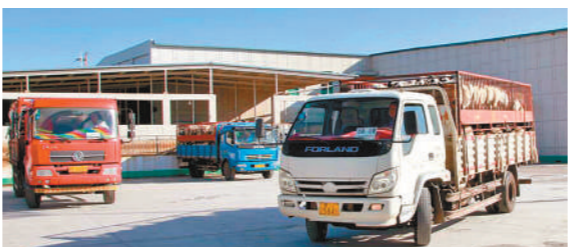
肉食品加工企业里拉羊的车络绎不绝。