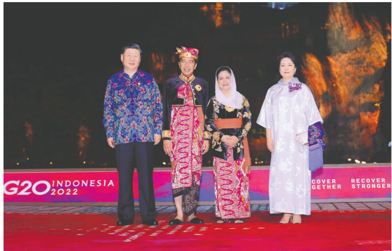
当地时间11月15日晚,国家主席习近平和夫人彭丽媛在印度尼西亚巴厘岛出席二十国集团领导人峰会欢迎晚宴。这是习近平主席夫妇在晚宴前同印度尼西亚总统佐科夫妇合影。