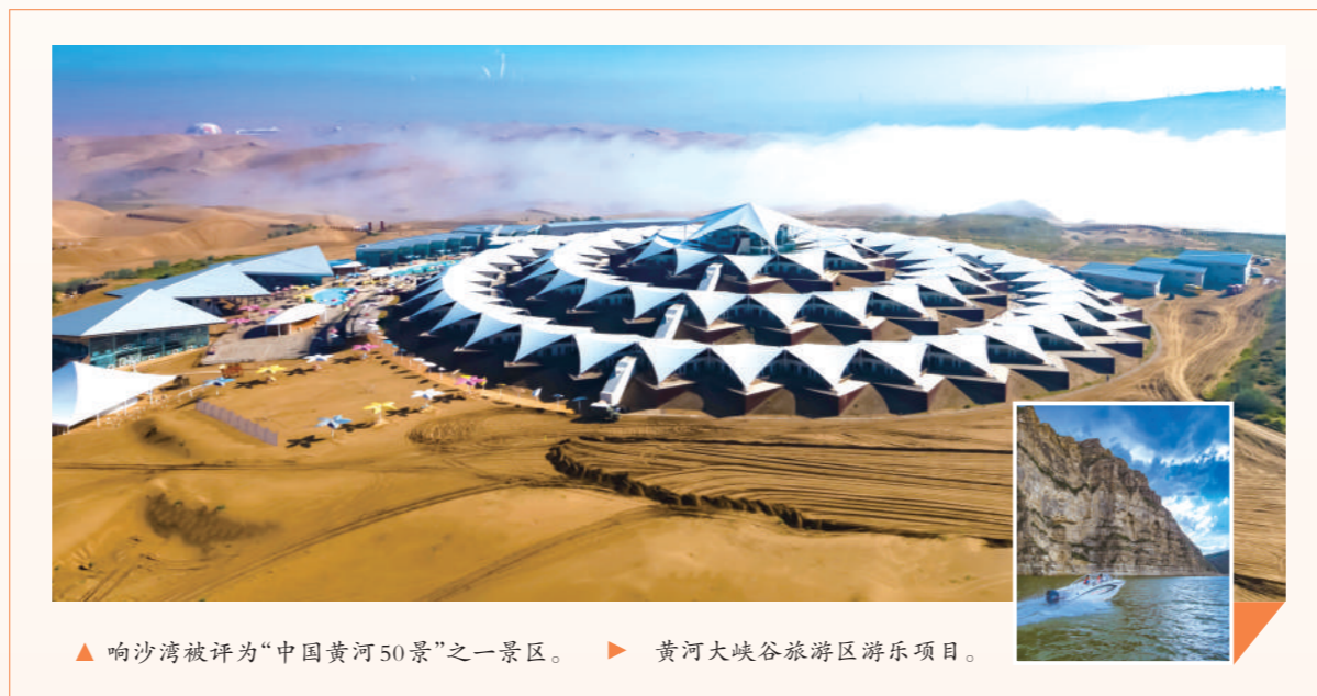
▲响沙湾被评为“中国黄河50景”之一景区。▶黄河大峡谷旅游区游乐项目。

位于准格尔旗魏家峁镇杜家窑村的包子塔,三边临水四周矗立。建于清朝光绪年间的崔家寨是包子塔现存最具代表性的古寨,已经被评为中国传统古村落。