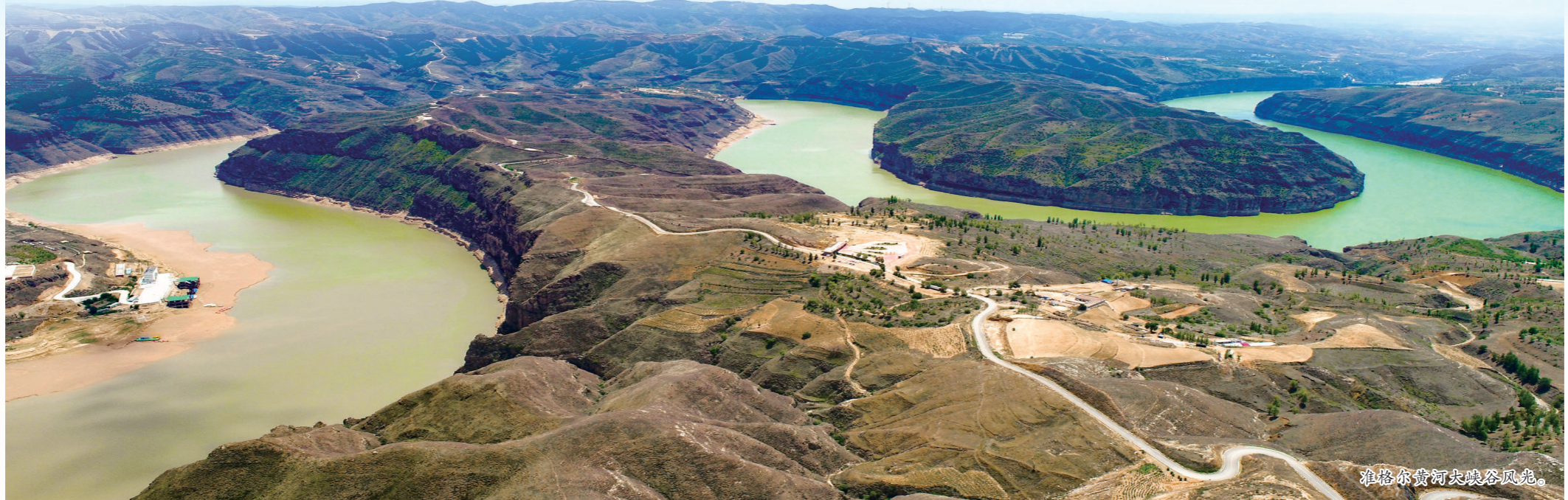
准格尔黄河大峡谷风光。