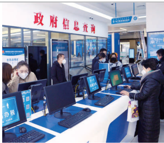
乌兰察布市政务大厅让企业和群众宾至如归

努力练就“五种招式”,有效拓宽招商引资合力。该市坚持靶向定位,围绕落实“五大任务”,编制产业链图谱、产业链招商地图,大力推动“链式招商”“平台招商”“以商招商”“以贤招商”“以会招商”。此外,持续推动营商环境优化,不断完善招商政策,持续优化办事流程,深入开展“五减一优”,全市办事环节、材料、时限、跑动次数在上年的基础上平均压减25%以上。(本报记者 海军)