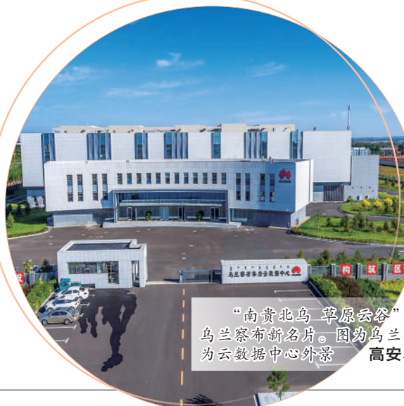
“向贵北鸟 卓原云谷”已成为乌兰察布新名片。图为乌兰察布华为云数据中心外景