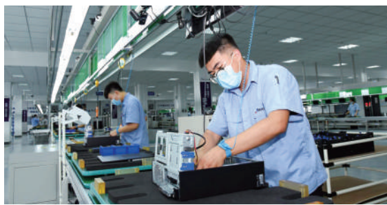
内蒙古同方科技有限公司同方制造基地投产