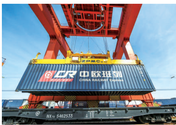
物流园对中欧班列进行装车作业