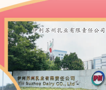
伊利苏州乳业有限责任公司。