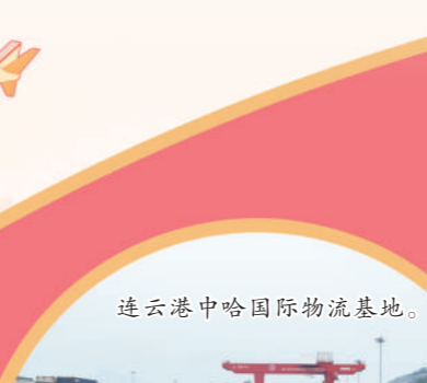
连云港中哈国际物流基地。