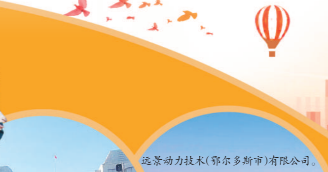
远景动力技术(鄂尔多斯市)有限公司。