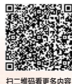
扫二维码看更多内容

(内蒙古日报·草原全媒记者: 贾奕村 王丽红 郝雪莲 李玉琢 李新军 于涛 马建奎 赵文莹 新华社·交汇点新闻记者:纪树霞 吕鑫 周天琦 曹阳)