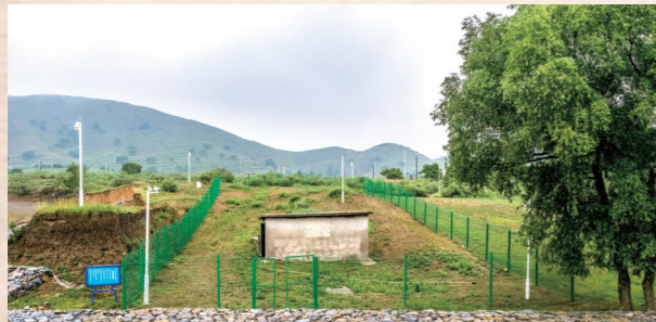
青龙山镇陈国公主与驸马合葬墓。

陈国公主与驸马合葬墓的发现,对评价我国北方少数民族在缔造中华民族文化中的历史贡献及深入研究辽代政治、军事、经济、文化、外交等提供了宝贵的实物资料。陈国公主与驸马合葬墓,被评为“七五”期间全国重大考古新发现,也被列为20世纪80年代中国十大考古发现之一。