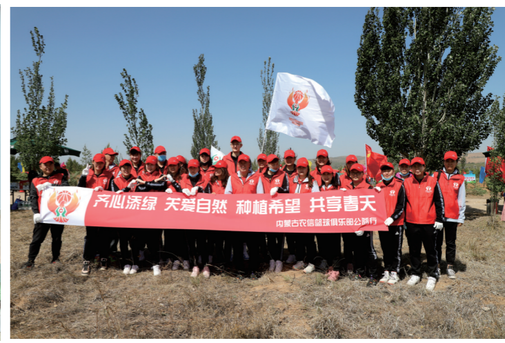
内蒙古农信篮球俱乐部参加植树活动。