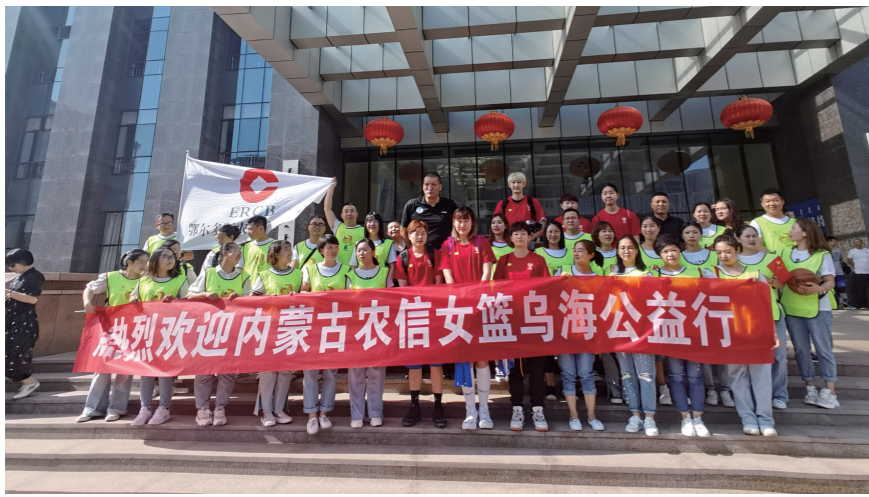
内蒙古农信女篮乌海公益行。