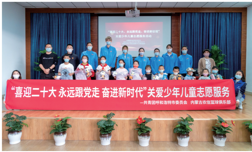
内蒙古农信篮球俱乐部参与关爱少年儿童志愿服务。