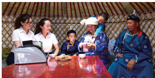
内蒙古农信阿巴嘎农商银行金融服务小分队走进牧民家中。

“争取金牌而不唯金牌，争名次而不唯名次，最难能可贵的不只是结果，而是不断挑战自我、超越自我，从而实现更好自我的体育精神。内蒙古农信女篮的姑娘们在比赛场上用自己的实际行动传递正能量、争夺荣誉，不仅持续记载着女篮队员们的梦想与荣光，更深深镌刻着内蒙古农信始终专注主业、深耕本土、服务‘三农三牧’、服务民营小微的责任和担当。”内蒙古农信相关负责人说。