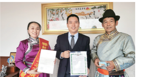
内蒙古农信鄂托克前旗农商银行发行首张新型农牧业经营主体专属乡村振兴卡。