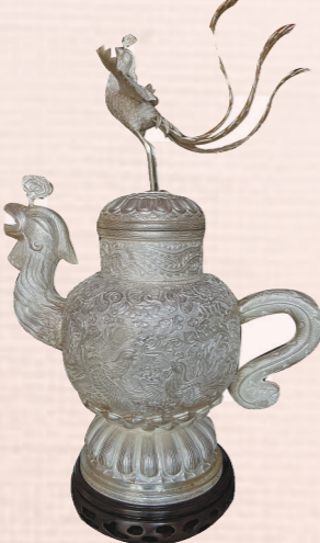
手工敲制篆刻作品纯银风壶。