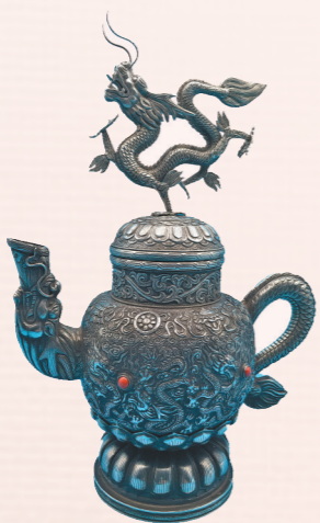
手工敲制篆刻作品纯银八宝龙壶。