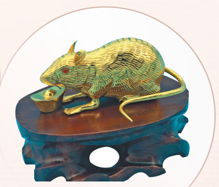
手工敲制篆刻摆件金鼠。