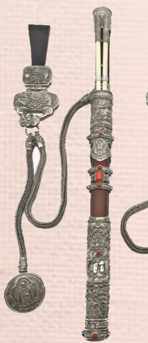
手工篆刻作品八宝吉祥蒙古刀。