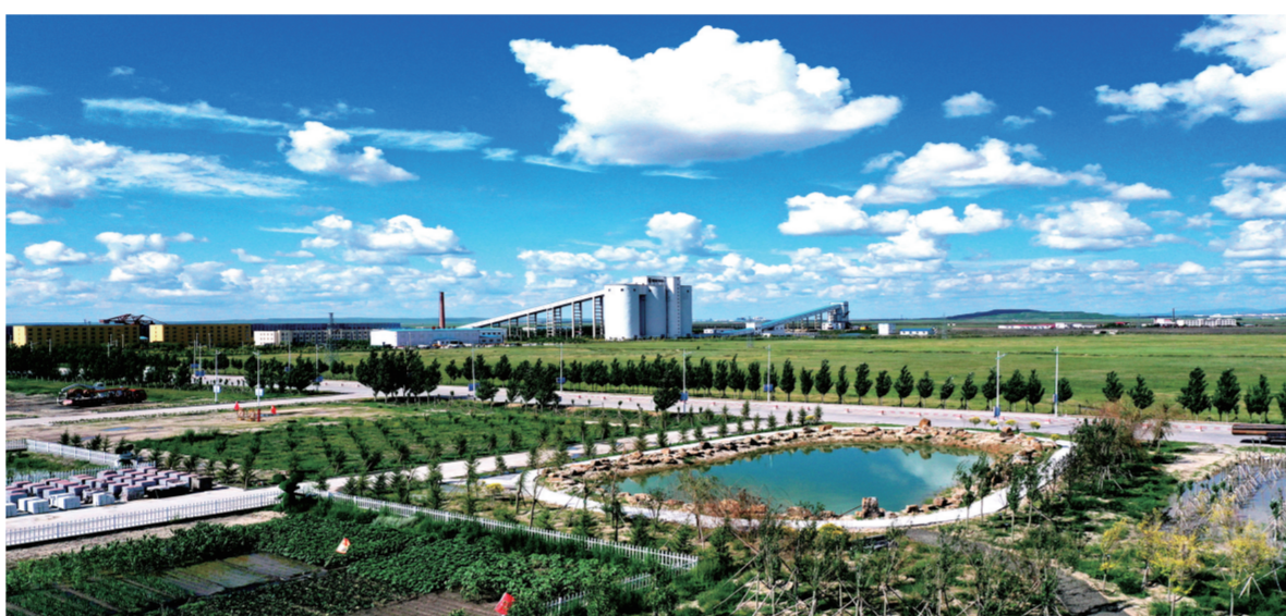
白音华露天煤矿绿色矿山。

煤矿智能化建设是实现本质安全的重要保障,是提质增效的重要举措,是实现高质量发展的关键途径。白音华露天煤矿公司全力推进智慧化矿山建设,将智慧化矿山建设布局到生产经营全过程。该公司基于工业互联网平台和数字工业操作系统,打造“一个平台、六项功能、两级管控、N个系统”,形成“监管平台+准入、预警、监控、应急、培训、无人”六大功能,使各系统数据、架构充分开放,实现安全生产系统深度融合、三维GIS系统融合、应急预案系统联动、消防、设备监测、巡检机器人等于系统、摄像头、传感器、温度、电流、电压、震动监测等800余个数据接入,实现安全生产压力传递到部门、车间、班组一线,有效促进了全员安全生产责任制的落实。2023年,获评“内蒙古自治区A类煤矿”称号,标志着该公司矿山建设达到行业先进水平。