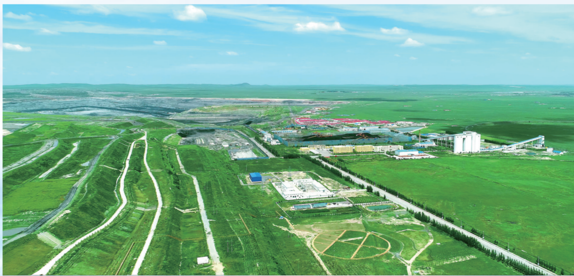
白音华露天煤矿公司南排土场生态修复治理成效显著。