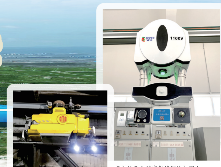
输煤廊道智能巡检机器人。