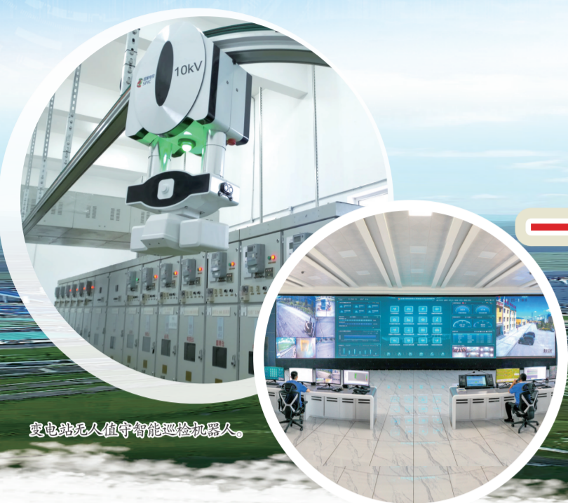
智能头盔值守智能巡检机器人。