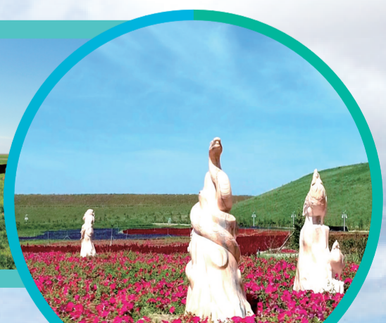
白音华露天矿南排土场玫瑰花海景观。

在“白音华露天矿”“同款式”厂区让人印象深刻。在创造绿色价值、建设绿色矿山的伟大征程中,该矿通过深度学习贯彻习近平生态文明思想,始终保持生态文明建设战略定力,加大生态系统保护力度,打好污染防治攻坚战,探索走出了一条以生态优先、绿色发展为导向的高质量发展新路子。2020年,该矿获得中国矿业高质量发展示范单位。2021年,生态修复治理项目获得全国矿山生态修复标准引领工程。