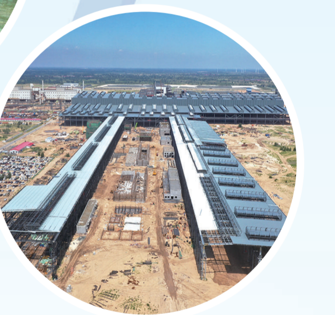
建设中的内蒙古(奈曼)经安有色金属材料有限公司不锈钢轧钢酸洗项目。