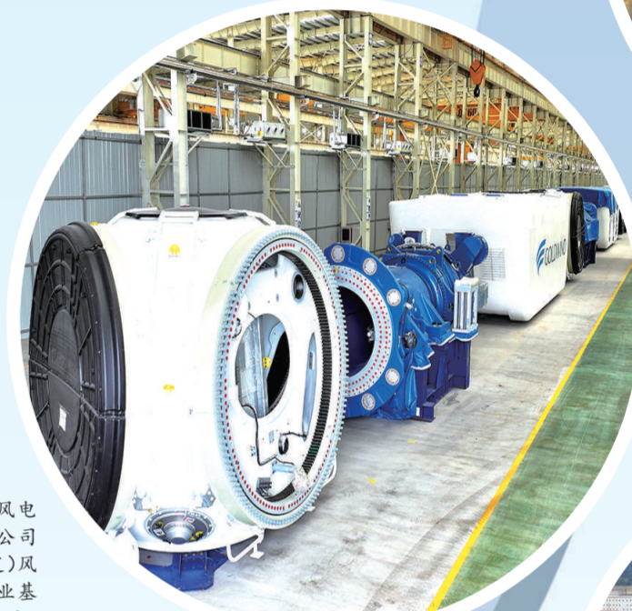
通辽金风电设备科技有限公司位于蒙东(通辽)风电装备制造产业基地,投资近3亿元,今年6月竣工投产。