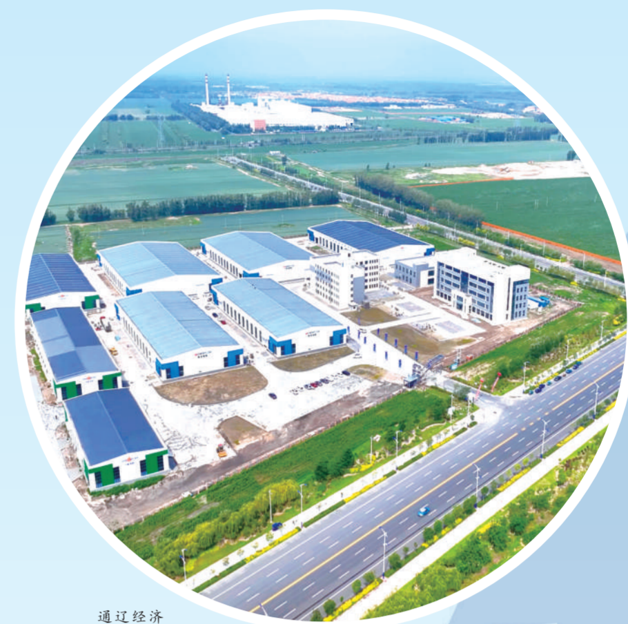
通辽经济技术开发区标准化厂房。