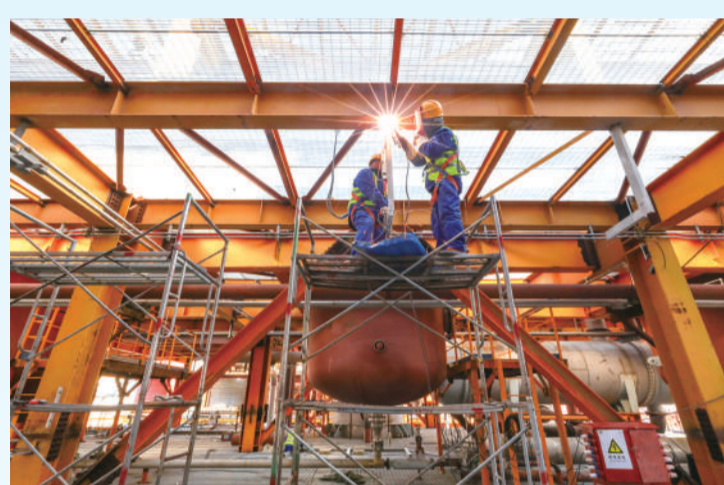
中化学(内蒙古)新材料有限责任公司年产30万吨煤制乙二醇项目施工现场。