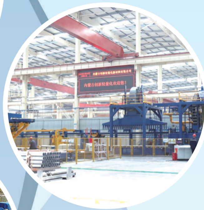
内蒙古创新轻量化新材料有限公司年产20万吨轻量化铝合金零部件及IT配件项目现场。