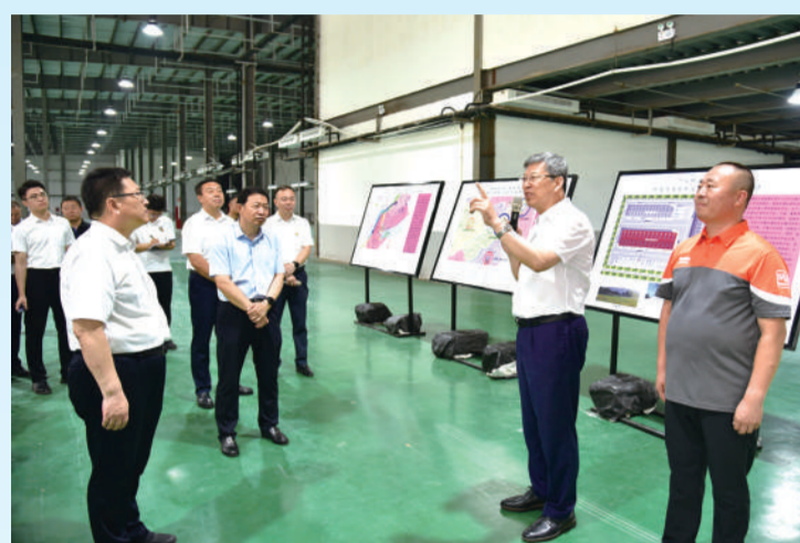
拉练现场。

“大拉练”的目的,是要让大家在比拼中相互学习、共同提高,为实现全年经济工作目标任务再加压力,再鼓干劲;是要和“我不如人”说再见,把在一些领域创一流、当标兵的雄心壮志树起来。要扛起担子、脚踩干劲,以等不起的紧迫感、慢不得的危机感、坐不住的责任感,把“大拉练”的精气神落实到招商引资、项目建设、优化营商环境的具体实践中去,升腾起高质量发展的新气派,奋力书写中国式现代化通辽新篇章。