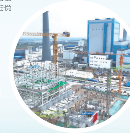
国家电网通辽2×350MW智慧热电联产机组项目正在进行土建回炉及设备安装。