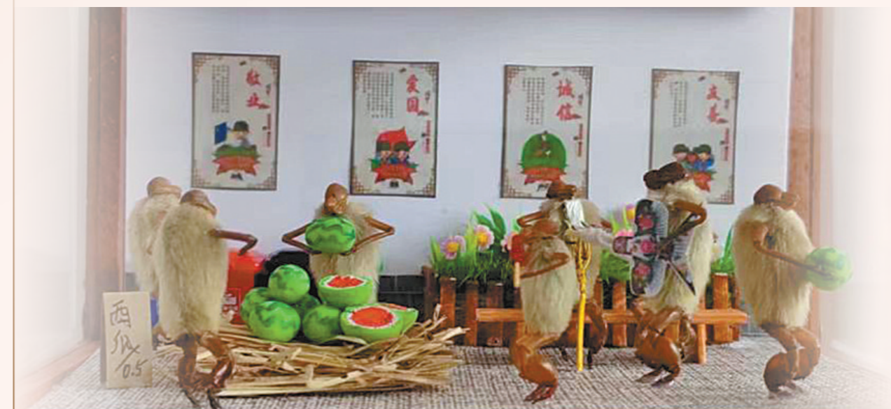
毛猴作品《伏天吃瓜》。

成群说，在过去北京的庙会上，“买‘猴料’，粘毛猴”曾是过年必有一景，无论穷富，家长都会为自己的孩子买一只毛猴过节，它是北京孩子最重要的玩具之一。