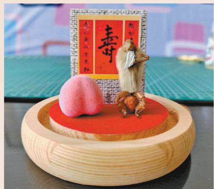
毛猴作品《延年益寿》。