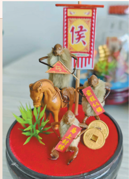
毛猴作品《马上封侯》。