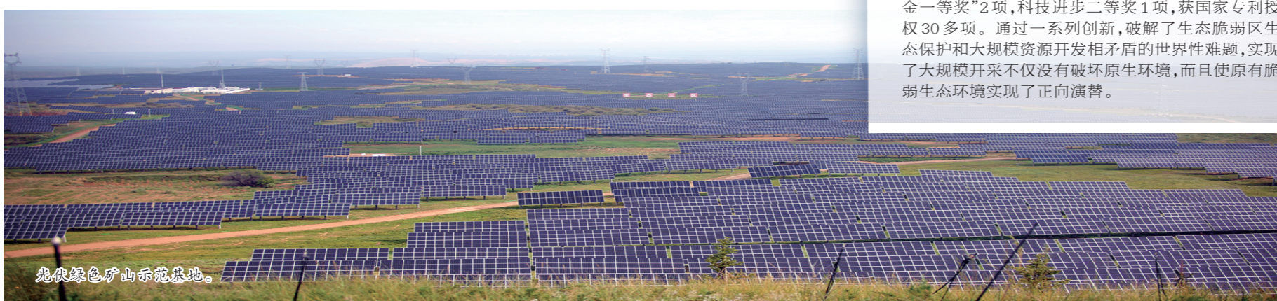
光伏绿色矿山示范基地。