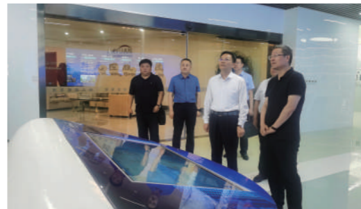
乌海市主要领导外出招商。

新材料产业定向招商推介,与参会企业精准对接。9月20日,在乌海市2023年秋季招商引资重点项目集中签约仪式上,集中签约13个重点项目,签约总金额达313.9亿元,签约项目涉及新能源、新材料、装备制造、现代煤化工、可降解材料、现代服务业等多个领域,将为乌海市进一步优化产业结构、扩大经济总量,走好以生态优先、绿色发展为导向的高质量发展新路子注入强劲动力、奠定坚实基础。此外,乌海市在9月还将陆续签约47个重点项目,签约总金额达114.17亿元。与此同时,乌海市成立45支招商引资小分队。1至8月,共派出96个工作组赴京津冀、长三角经济带、粤港澳大湾区等重点区域,考察企业、行业协会314家;接待来访客商256批次、810人次;乌海市政党政主要领导带队外出招商18次。