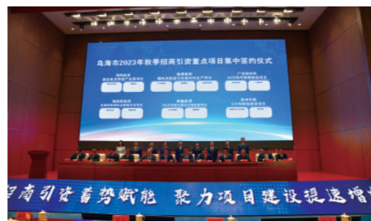
乌海市2023年秋季招商引资重点项目集中签约仪式。

区、各部门招商引资工作的积极性和主动性。乌海市完善招商引资工作联席会议制度,对全市招商引资工作推进情况实行“旬通报、月通报、季总结、年排名”,推动形成招商引资强大合力。实行领导干部包联制度,推行“一个项目、一位领导、一个专班、一套方案、一抓到底”的“五个一”包联和“一企一策”专班式包联服务,及时有效地为项目纾困解难,并充分运用重大项目调度平台功能,切实推进项目按计划加快建设。今年,乌海市以各区、各责任部门确定的年度市级重点项目为载体,实行“争先进位、赛马比拼”工作机制,细化量化重点项目阶段性工作目标和完成时限,以挂图贴牌、排名比拼、督办考核等措施,推动项目数量、建设质量、投资总量“三量”齐升。