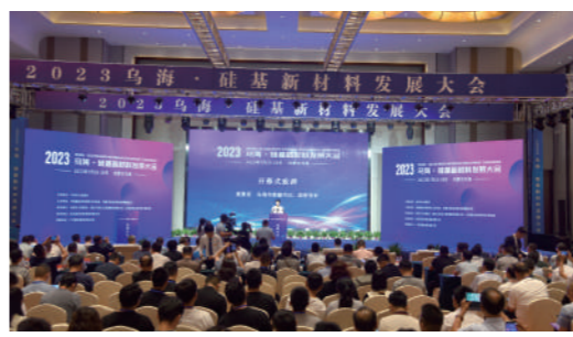
以重要会议活动开展招商引资。

项目好项目,加快形成一批新的经济增长点、支撑点,助力传统产业迭代升级和新能源、新材料两大全产业链基地建设,推动产业转型、动能转换取得新突破。乌海市认真落实产业链长制,集中引进一批以煤焦化产业深加工为方向的集群项目,重点布局针状焦、环氧丙烷、锂电池负极材料、锂电池电解液、磷酸铁锂动力电池正极材料等项目;集中引进一批硅基新材料产业集群项目,重点布局硅基气凝胶复合材料、有机硅及深加工、特种硅橡胶、颗粒硅、纳米硅等项目;集中引进一批精细化工集群项目,重点布局聚氯乙稀树脂、氯化聚氯乙烯、醋酸乙烯、环氧乙烷、苯甲酰氯等项目;集中引进一批可降解材料集群项目,重点布局聚四亚甲基醚二醇、N-甲基吡咯烷酮、聚氨基甲酸酯纤维(氨纶)、γ-丁内酯等项目。