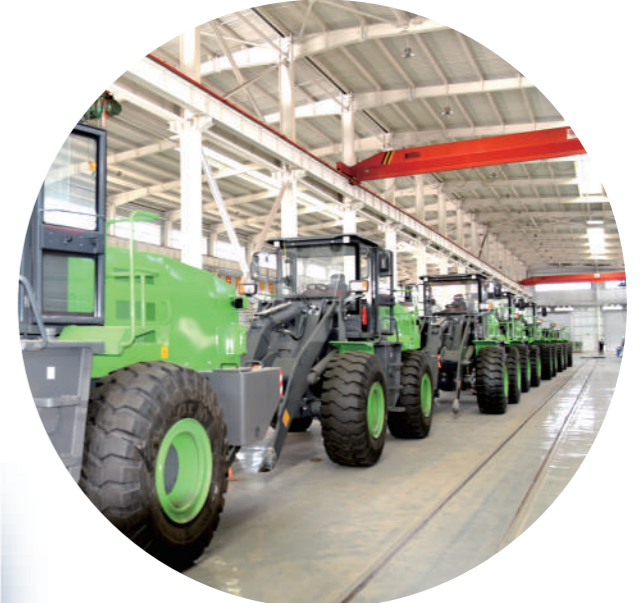
海易通新能源装载机。