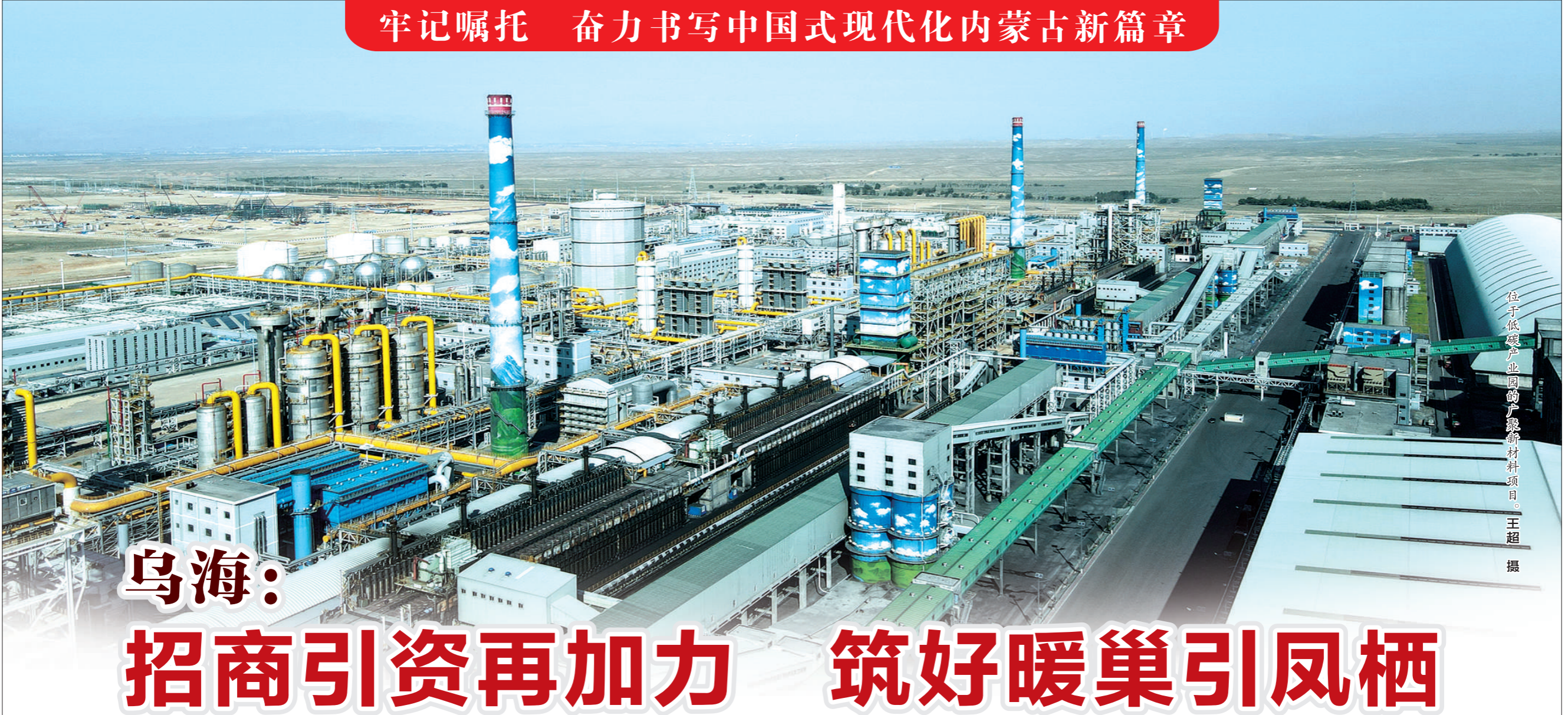
位于低碳产业园的产聚新材料项目。