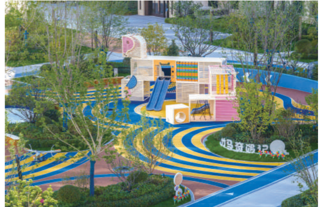
中海臻如府儿童活动区实景图,拍摄于2023年9月。

秉承一贯的创新精神,中海臻如府将盛唐建筑的恢弘大气与呼和浩特市的城市性格相融合,承袭唐风精粹的同时,由内至外将东方建筑韵味极致演绎,只为呈现古今相宜的生活答案。