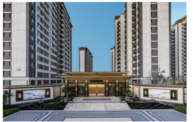
中海臻如府主入口城市会客厅全景图,拍摄于2023年8月。