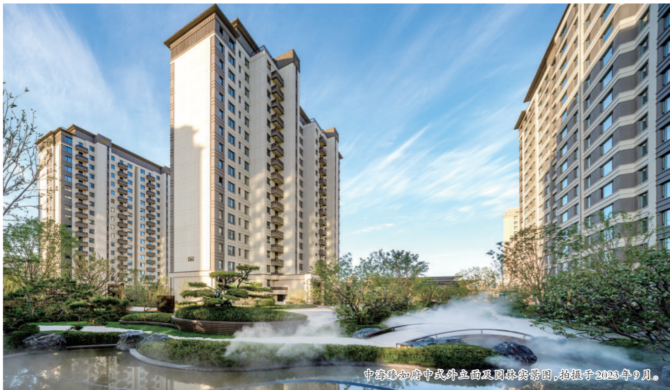
中海臻如府中式外立面及园林景观实景图,拍摄于2023年9月。