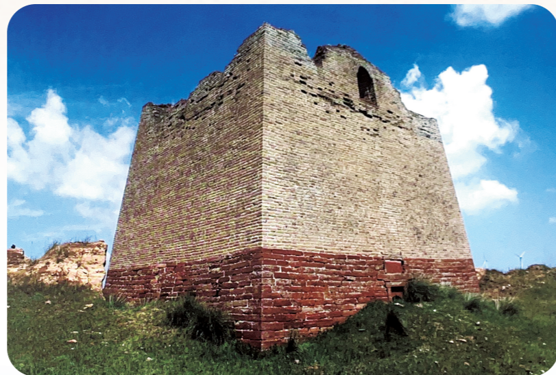
▲呼和浩特市清水河县新村3号敌台徐氏楼。

位于山西省偏关县的老牛湾堡,毗邻黄河,与清水河老牛湾唇齿相依,同被称为“黄河与长城握手的地方”。城堡三面环水,所处高台地形似“牛头”伸入黄河,只有南面与青石梁遥遥相接。而且老牛湾堡北部依托望河楼、烽火台等军事设施,与长城边墙的防御功能相呼应。老牛湾堡及长城的地理优势,使人造军事防线与自然天险浑然一体,是明长城沿线最为独特的堡、墙、台、水结合的案例。