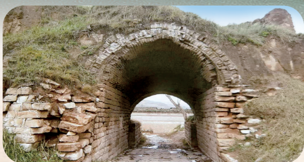
▲红门互市通关之地偏关县水泉堡南门。