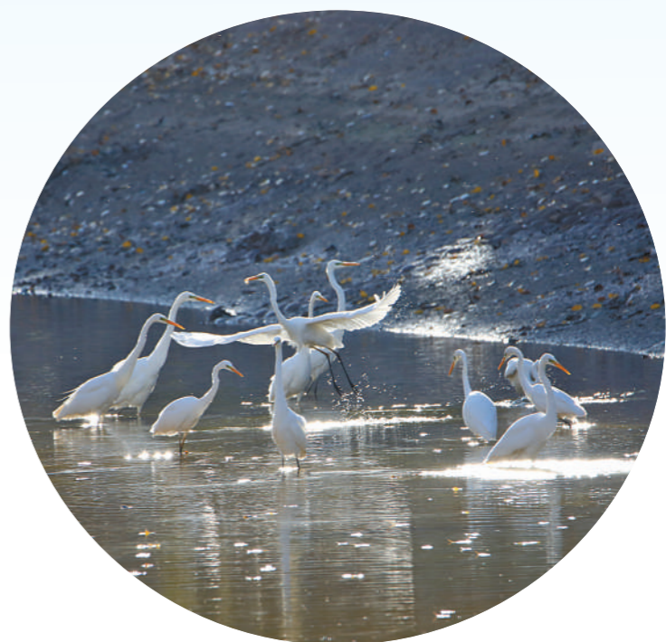
白鹭在巴彦淖尔市磴口县境内的黄河湿地停歇逗留。

东风正劲好扬帆。只要全区上下以挑大梁扛重担的使命担当打好“三北”工程攻坚战，以扛牢“国之大者”的高度自觉全面推进美丽内蒙古建设，定能把我国北方重要生态安全屏障构筑得牢不可破，书写生态文明建设新篇章。