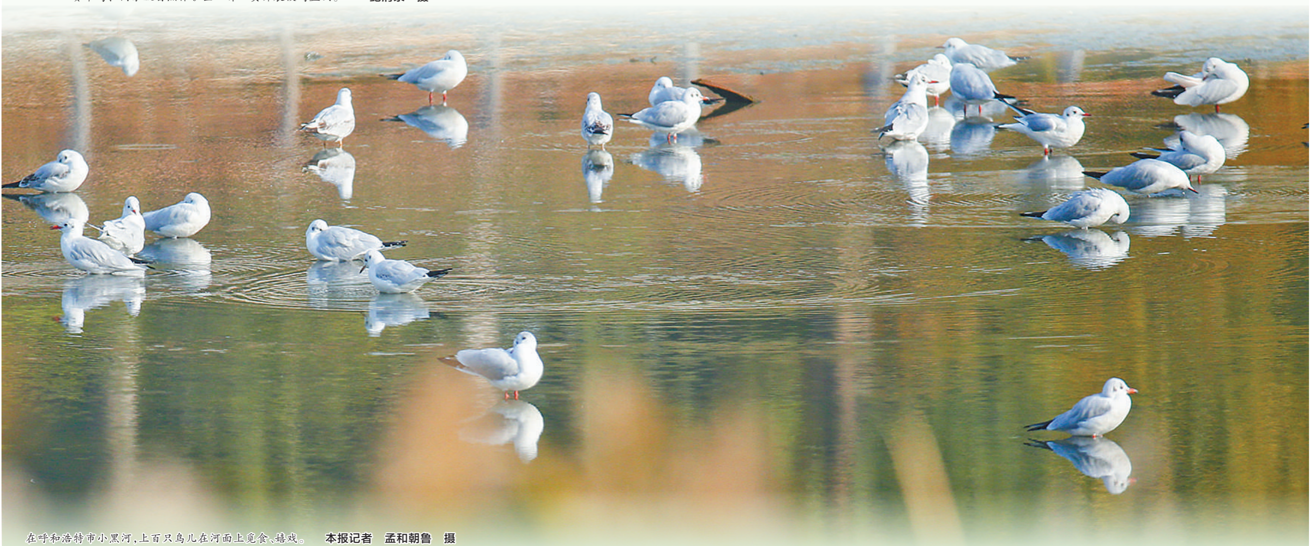
在呼和浩特市小黑河，上百只鸟儿在河面上觅食、嬉戏。