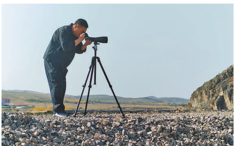
赛罕乌拉国家级自然保护区工作人员开展候鸟监测。