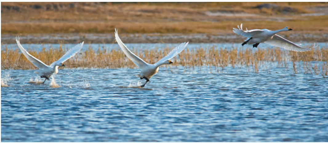
通辽市科左后旗境内湿地候鸟成群。