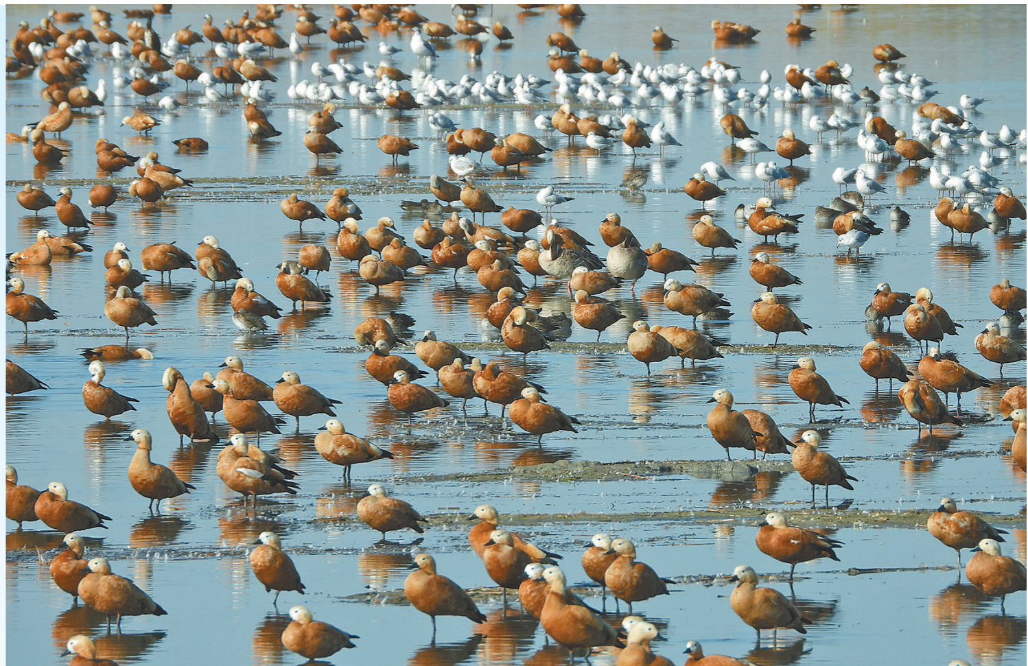
成群的赤麻鸭、绿头鸭、鸿雁等鸟类在岱海戏水。