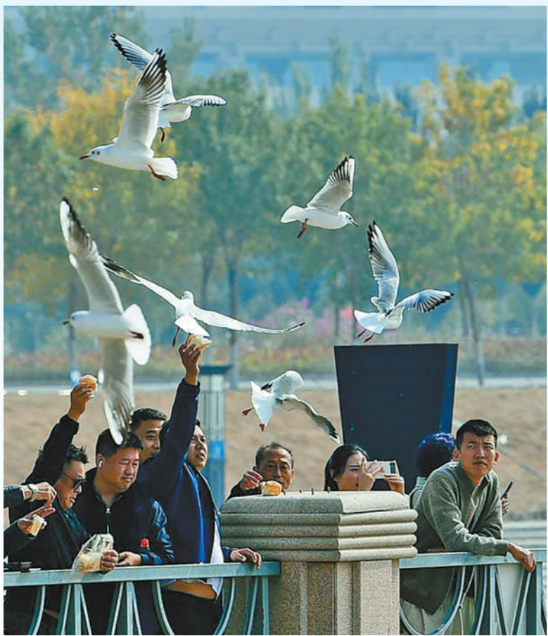
游客在乌海湖畔喂食红嘴鸥。