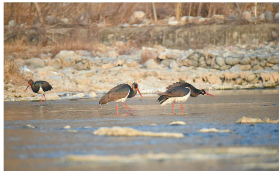
国家一级保护动物黑鹇在锡林郭勒草原补充能量。