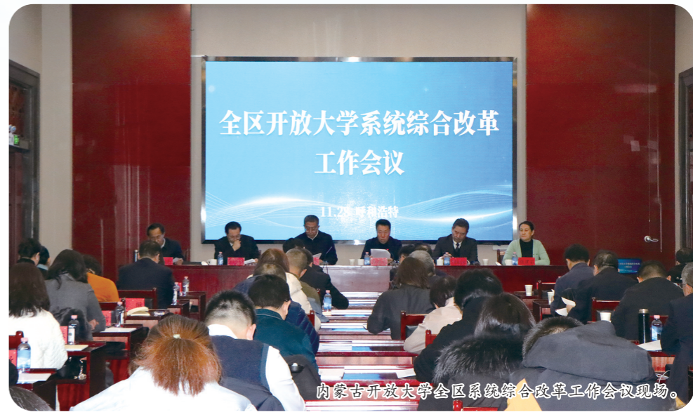
内蒙古开放大学全区系统综合改革工作会议现场。

服务国家及自治区发展战略,在组织实施国家开放大学开放教育的同时,在自治区教育厅指导下,开展中专、专科、本科学历继续教育,紧贴市场、紧贴产业、紧贴需求,设置应用型、技能型学科专业,面向不同人群和不同需求提供优质、高效的高等教育服务。充分发挥内蒙古开放大学三级办学体系优势,依托终身教育平台、数字化教学资源,大力发展非学历继续教育,积极开展短期灵活教育,拓展社区教育,扩大社会培训,办好老年教育,使社区教育成为国民学习新渠道、社会培训成为开放教育新品牌、老年教育成为教育领域新亮点。