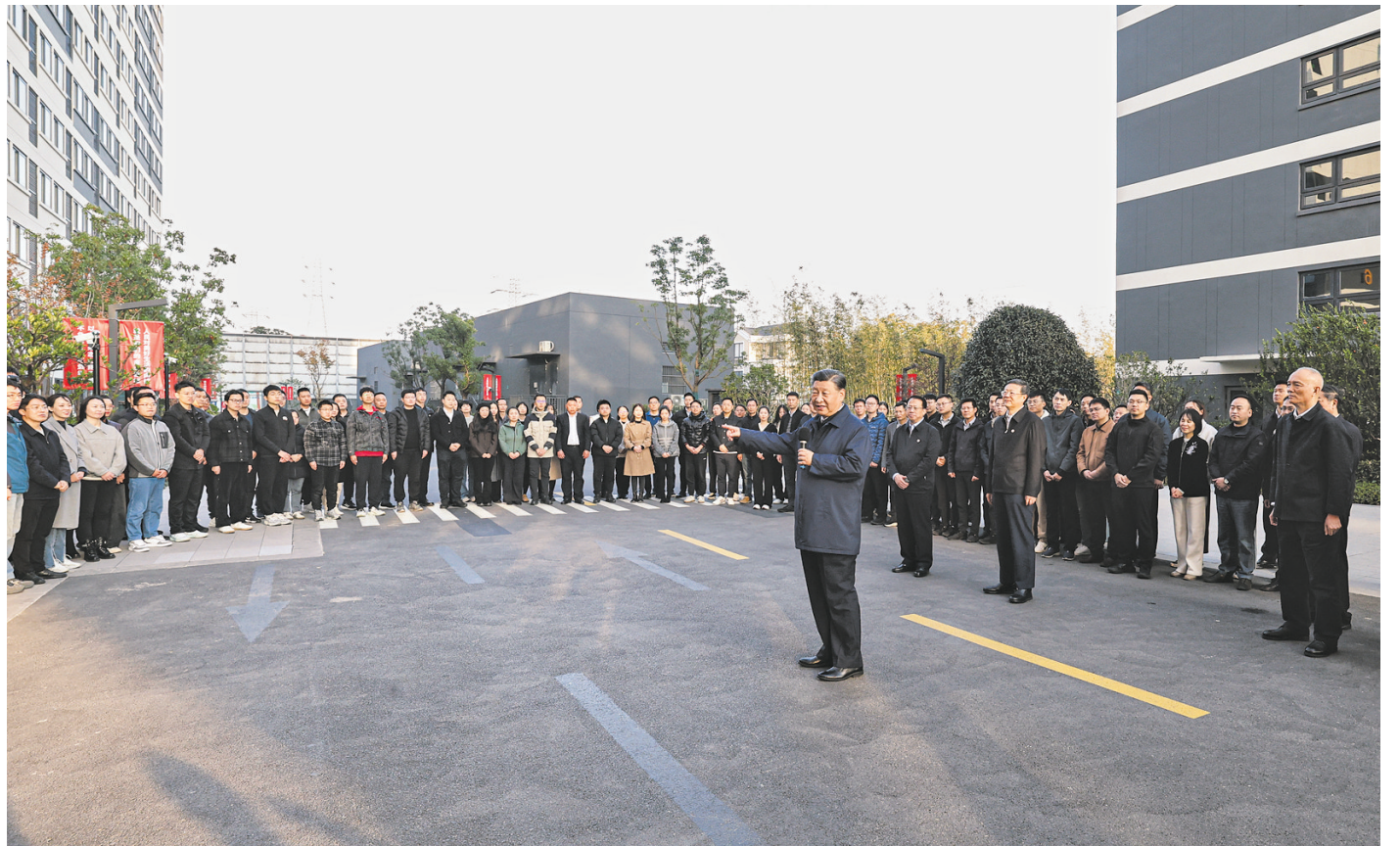
11月28日至12月2日,中共中央总书记、国家主席、中央军委主席习近平在上海考察。这是11月29日下午,习近平在闵行区新时代城市建设者管理者之家,同社区居民亲切交流。

新华社上海/江苏盐城12月3日电 中共中央总书记、国家主席、中央军委主席习近平近日在上海考察时强调,上海要完整、准确、全面贯彻新发展理念,围绕推动高质量发展、构建新发展格局,聚焦建设国际经济中心、金融中心、贸易中心、航运中心、科技创新中心的重要使命,以科技创新为引领,以改革开放为动力,以国家重大战略为牵引,以城市治理现代化为保障,勇于开拓、积极作为,加快建成具有世界影响力的社会主义现代化国际大都市,在推进中国式现代化中充分发挥龙头带动和示范引领作用。