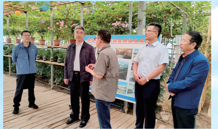
实地调研走访企业经营情况和融资需求，助力市场主体发展壮大。