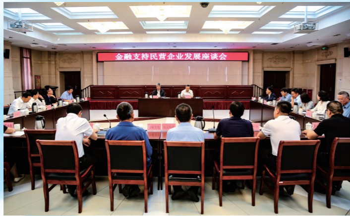
召开“金融支持民营企业发展座谈会”，回应企业诉求，研究解决融资困难，优化提升金融服务。