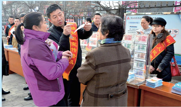
开展“反假币金融知识宣传”，切实提升人民群众识别和防范假币能力。