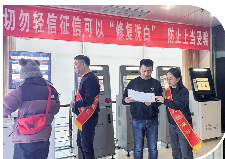
加强征信服务供给，提升社会公众信用意识，促进社会征信体系建设。

组织金融科技赋能乡村振兴示范样板工程，指导金融机构运用自治区土地经营权流转管理系统开办基于土地确权数据的贷款业务。截至目前，全区农村土地(草牧场)承包经营权抵押贷款余额120亿元，较年初增加19.5亿元。支持金融机构通过“金融机构+活体牲畜+第三方监管+保险”等模式，拓宽畜牧业质押担保范围，截至目前，全区活体牲畜质押贷款余额94亿元，较年初增加10.8亿元。督促金融机构用好再贷款再贴现，2023年以来累计发放支农再贷款、再贴现586.4亿元，同比增加211.9亿元。推动金融机构创新推出农牧业专属贷款产品，全区金融机构先后推出“粮储贷”“乡村振兴贷”“高标准农田贷”等44款信贷产品，覆盖农资储备、农机具购置、农副产品加工等各个环节。发挥农牧业信用体系建设的基础性、保障性作用，为全区1.9万个新型农牧业经营主体建立信用档案，为9000余个主体发放信用贷款，贷款余额10.3亿元。推进农村牧区支付服务环境建设，综合采用预约服务、流动服务车等方式，加大支付服务供给。2023年以来，全区涉农银行机构收到支付服务预约1.6万余份，完成率99.3%，43辆流动银行车赴1206个嘎查村办理业务10.3万余笔。