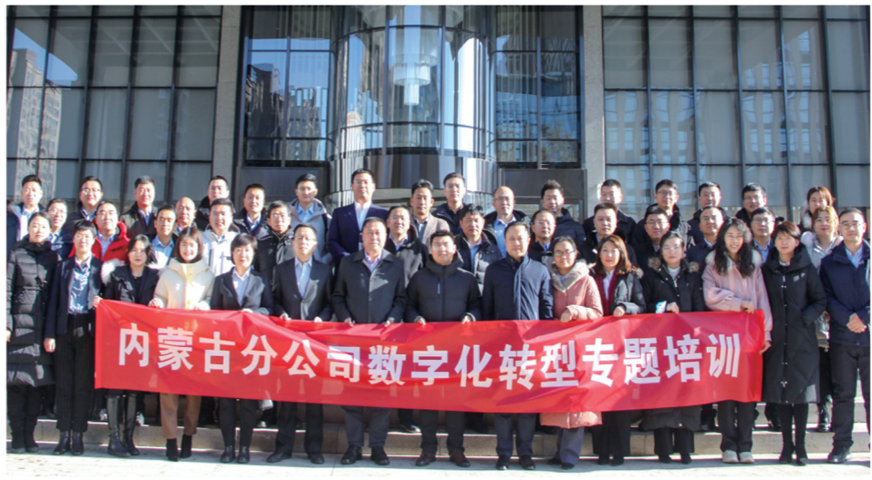
内蒙古分公司举办数字化转型专题培训。