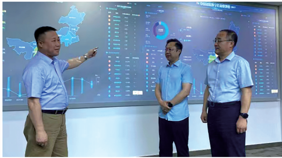
党委班子讨论数字化转型发展思路。