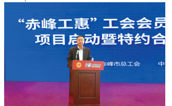
联合地方总工会搭建“赤峰工惠”万家普惠商城。

基于对辖内商业银行的了解,内蒙古银联通过云网平台实现整合银联体系及银行双方商户资源和服务场景,从而为银行客户与“云闪付”客户的权益、功能贯通,释放“懂行”价值,助力商业银行数字化转型不断推进,为银行业移动支付发展打开新的空间。