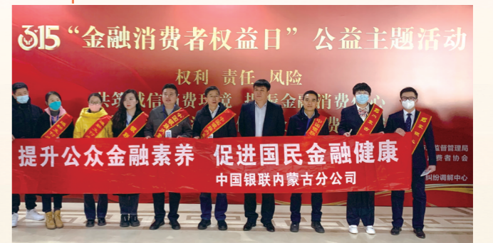
开展“消费者权益保护”公益宣传活动。

市、赤峰市、通辽市、巴彦淖尔市、乌兰察布市、兴安盟、呼伦贝尔市、二连浩特市等11个盟市以及27个旗县区通过银联云闪付开展消费促进活动,各盟市累计签约出资1.63亿元,政企联合商户出资1448万元,商户单独出资2623万元。