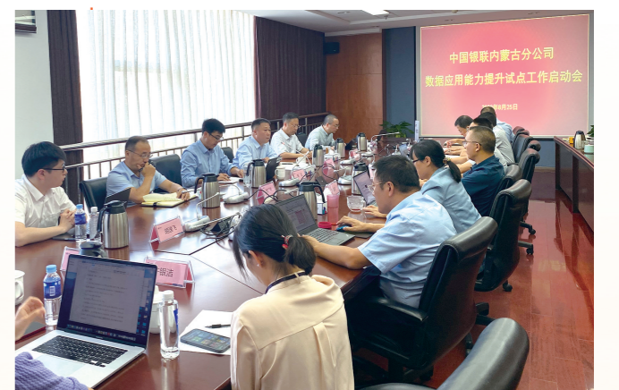
研究部署数字化应用能力提升策略。

“云闪付”有价券等;二是为用户实现各项优惠的“看、领、查、用”一站式便利服务;三是用户在“蒙U惠”微信小程序会员中心享受专享优惠,通过每天签到、线上线下消费等均可领取积分兑换淘宝、微信小程序、超市、观影、还款缴费、影音等超值立减券。实现提高用户触达,持续全面服务内蒙古辖内“云闪付”用户的目标。